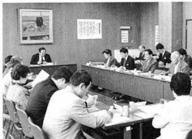
未来博参加推進事業など協議する 国見町うつくしま未来博推進協議会

参加推進事業の詳細は左ページに掲載しており、補助を受けるためには各条件に基づき、補助金申請等の手続きが必要になります。所定の用紙等は推進協議会事務局(役場企画商工課内)に準備しており、手続き等をご説明いたしますので、お気軽にお申出ください。