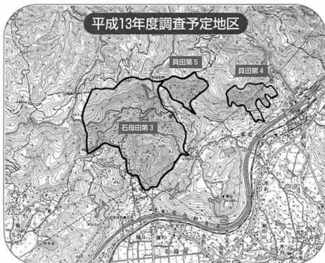
平成13年度調査予定地区

平成十三年年度の国土調査は、貝田地区及び石母田地区の山間の一部、調査予定面積一・九六㎏を実施します。これにより両地区は全字終了します。