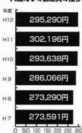
一人当たりの医療費の推移