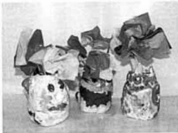
▼「花瓶」 森江野幼稚園児合作