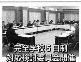
完全学校5日制 対応検討委員会開催

少し昔までは、近所の子どもたちが、学年は違っても一緒に遊び、家庭では家族の一員として掃除や風呂