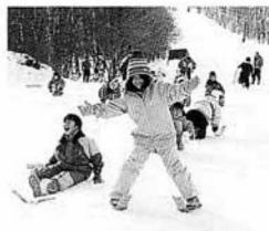
塩沢スキー場での竹スキー

静岡西の友が、浜名湖畔にある西気賀小学校との「海の子・山の子交流」は、今から十四年前に始まり、児童が行き来するようになって六年目になります。冬の小坂に今年も西気賀小の五年生二十三名が二月八日から一泊二日の日程で訪れました。夏には小坂小が西気賀小を訪問しており、半年ぶりの再会です。小坂小学校では歓迎セレモニーと「五つ峰集会」が催され、「ゲーム」とことん小坂アドベンチャーや餅