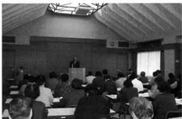
二月二十一日の成人学級閉講式

また、「町の文化財」の見学学習での歴史探訪や合同学習会による「町政を知る」では、町村合併問題について町長講話、そして、町議会傍聴と国見町の住民として、町政を深く理解することができました。