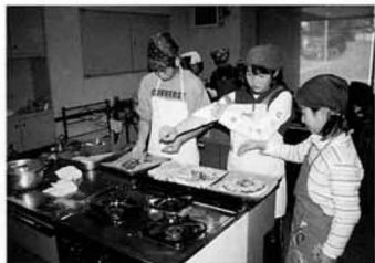
最後の学習「手作りピザ」に 取り組む学級生