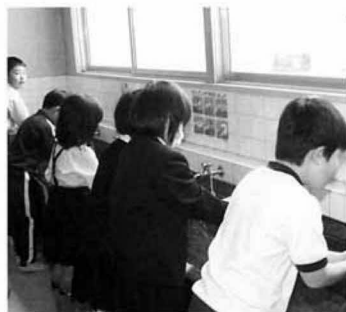
休み時間毎に手洗いとうがいを慣行