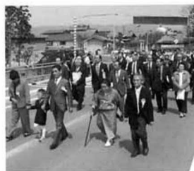
和平橋の渡り初め

平成十二年度から緊急地方道整備事業として改修を進めてきた、川内地区の「富士見橋」と徳江南部地区「和平橋」の渡り初めが、四月十三日にそろって開催され、各地区の三代夫婦を先頭に、関係者が徒橋し、完成を祝いました。 富士見橋は、町および国土交通省により阿武隈川「平成の大改修」の一環である滝川改修とともに架け替えを進めていたもので、橋梁延長四十二m、全幅員七mからなります。また、和平橋は町道五号および佐