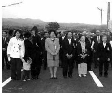
富士見橋の渡り初め

平成十二年度から緊急地方道整備事業として改修を進めてきた、川内地区の「富士見橋」と徳江南部地区「和平橋」の渡り初めが、四月十三日にそろって開催され、各地区の三代夫婦を先頭に、関係者が徒橋し、完成を祝いました。 富士見橋は、町および国土交通省により阿武隈川「平成の大改修」の一環である滝川改修とともに架け替えを進めていたもので、橋梁延長四十二m、全幅員七mからなります。また、和平橋は町道五号および佐