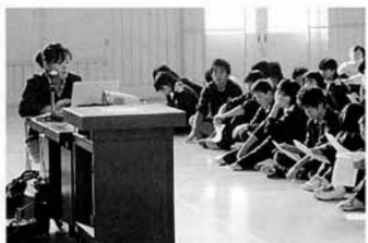
「東南アジア青年の船」報告会 県北中にて

現地での滞在は、約五日間ごとの短期間でしたが、カルチャーショックを感じた場面が多々ありました。各国特有の食生活、交通マナー、公衆衛生、宗教などに基づく生活は、日本での生活とは想像を絶する経験でした。イスラム教徒の礼拝を間近で見たり、ご飯を手で食べたり、モーターバイクにひかれそうになったり、と衝撃的な出来事がいくつもあり「郷に入れば郷に従え」という諺を胸に刻み、現地の生活に溶け込もうとする自分がいれば、そういう習慣に戸惑いを隠せない自分もいて、その狭間に立った自分を何度目にしたか分かりません。しかし、このような出来事は、現地では当たり前のことで別には珍しくないのです。彼らの文化は、彼らにとつて空気のようなものとも自然にあるもので、それを特別視する必要はありませんでした。この事業を踏まえ、自分ができることは、これから留学生の日本生活でのお世話を続けていくことだと思っています。これが、私流の国際交流かもしれません。外国に行き現地の人と触れ合うことも大切ですが、今身近にいる人との付き合いも大切にしていきたいのです。今回、見知らぬ土地でお世話になったたくさんの方への感謝も踏まえ、この事業を通して得たことを留学生などに還元できればと考えております。