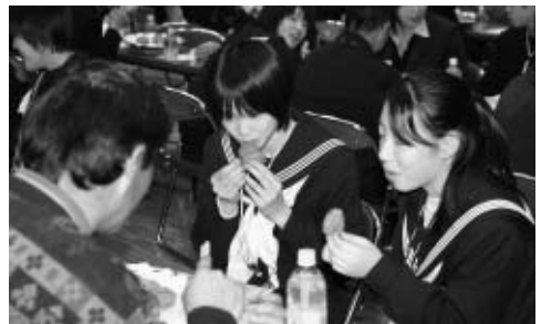
ホストファミリーと一緒に。初「あんぼ」お味はいかが？

最後の晩は「お別れパーティ」が開かれ、ホストファミリーとの最後の食事を楽しみ、短い間の思い出を語り合う姿がありました。 大分とは比べ物にならない寒さ、初めてのスキー体験、そして何よりホームステイで仲良くなった友達。一生忘れることのない、抱えきれない思い出を胸に帰路につきました。