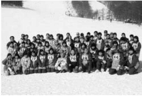
ものすごくいい天気でした、1日目は...

あいさつがありました。 歓迎会では、ホストファミリーとも対面し、福島・国見での夜を過ごしました。 翌14、15日、団員は宮城県 のえぼしスキー場で、生まれて初めてのスキーを楽しみました。初めての雪に大喜びの様子で、2日目の猛吹雪にもめげず、熱心にスキー講習を受けていました。