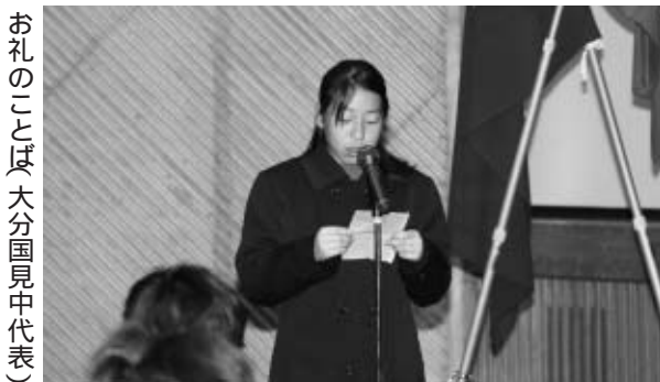
お礼のことは、大分国見中代表