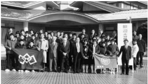
全員集合！またいらっしやい。」