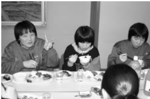
体を動かせば、お腹が空くんだ。

あいさつがありました。 歓迎会では、ホストファミリーとも対面し、福島・国見での夜を過ごしました。 翌14、15日、団員は宮城県 のえぼしスキー場で、生まれて初めてのスキーを楽しみました。初めての雪に大喜びの様子で、2日目の猛吹雪にもめげず、熱心にスキー講習を受けていました。