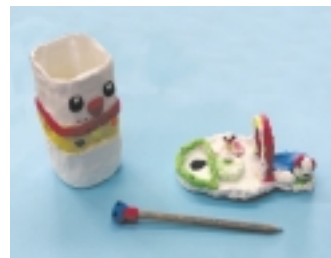
3年 田中なつみ 「カラフルねん土のお店へようこそ」