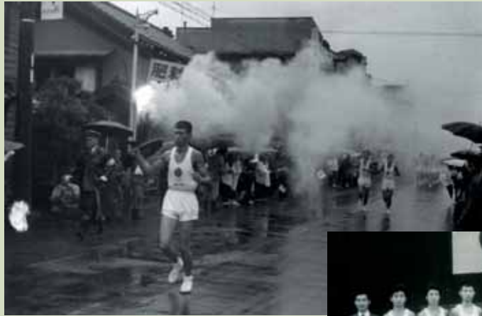
冷雨の中、疾走するランナー（第4区藤田車庫前〜町境）

昭和39年10月10日のオリンピック東京大会の開会式を前に、9月28日午後2時30分、国見町において聖火リレーが行われた。