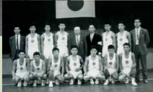
聖火リレーの正副走者に選ばれた12名の模範青年たち

聖火を県境で宮城県側から受取り、4チーム92名の若人たちによって運び、桑折町チームに引き継いだ。