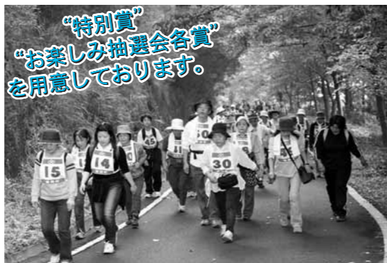
“特別賞” “お楽しみ抽選会各賞” を用意しております。

◆参加申込…保健福祉課保健係へ10月2日(金)までお申込みください。☎585-2783