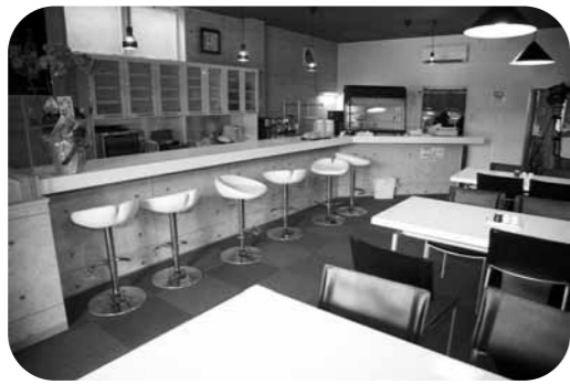
▲おしゃれで落ちつきのある店内

【営業時間】 午前10時～午後8時 【定休日】 毎週水曜日 【問い合わせ】 電話 024-585-5319