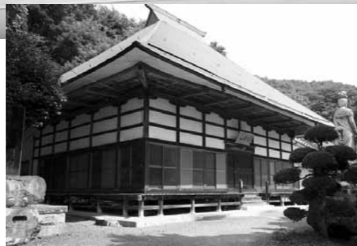
▲映画の舞台となる龍雲寺