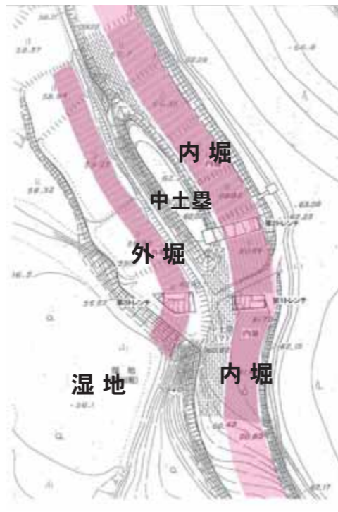
遠矢崎地区の二重堀から一重堀になる地点の構造