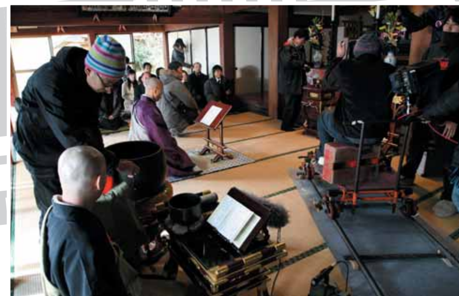
↑石母田龍雲寺本堂での法要の撮影シーンの様子。