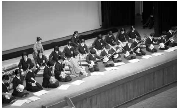
▲オープニングでは伝統文化子ども教室「いい音の会」の皆さんが箏や三味線の演奏を披露