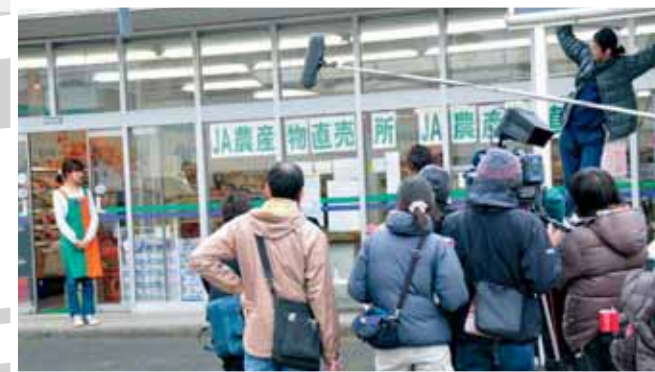
↑Aコープでの撮影シーンの様子。店員扮する「ともさかりえさん」