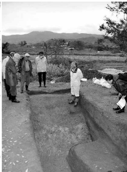
指導委員による発掘現場の視察