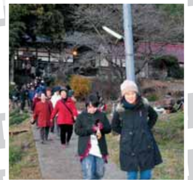
↑龍雲寺参道を歩くエキストラの皆さん。奥に見えるのが龍雲寺。