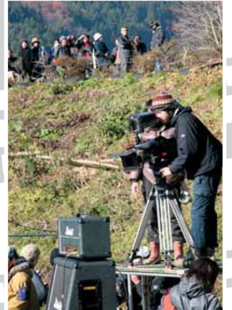
↑撮影の様子を身守る地元住民。