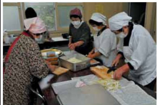
↑各団体の婦人部を中心に、毎日、定住促進住宅集会所においてスタッフ等の食事のお世話していただきました。