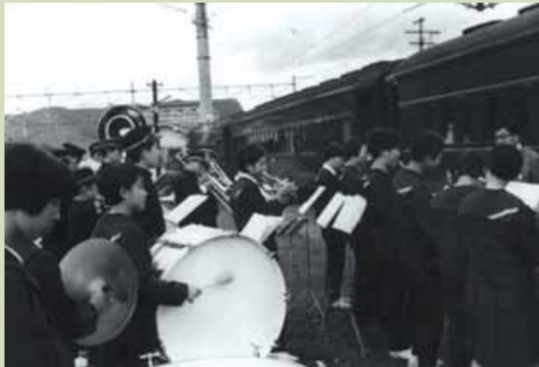
10月1日、通勤通学始発列車設定実施を記念し演奏する県北中学生徒。

日本国有鉄道(当時)は昭和43年10月1日に大規模なダイヤ改正を行いました。このダイヤ改正はその日付から『ヨンス・トウ』とも呼ばれました。当時国鉄がこのような大々的なキャンペーンを展開した背景には、戦後の高度経済成長によって拡大した鉄道輸送体系の再編成がありました。