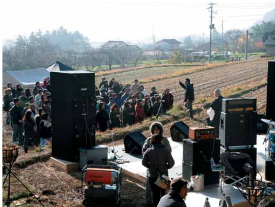
↑クライマックスのライブ撮影シーンの様子、夜は周りに松明が灯され、本当のライブのように熱く盛り上がりました。