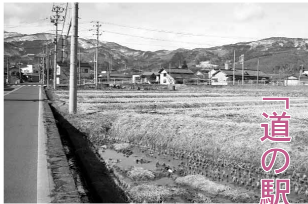
道の駅建設予定地 (国道4号線と県道浪江・国見線の交差点)