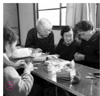
①健康体操を楽しむ ②手工芸「ざるぼぼ」作り ③サロン（お茶を飲みながら会話） ④健康相談で血圧測定