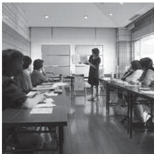
熱心に学習する受講生

読書のよろこびを! 「本の基本と選び方講座」を10月2日、10日の2回にわたり、福島県立図書館、企画管理部、児童資料チームより専門司書を講師に招き開催しました。 1回目は、図書の選び方をテーマに、読書の魅力や必要性と効用、図書室の楽しみ方について、2回目は子どもと読書をテーマに「読み聞かせ」や「読書」の重要性と効果などを学びました。講師からの「メディアやインターネットなど、情報