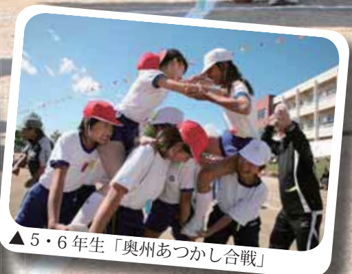
▲5・6年生「奥州あつかし合戦」