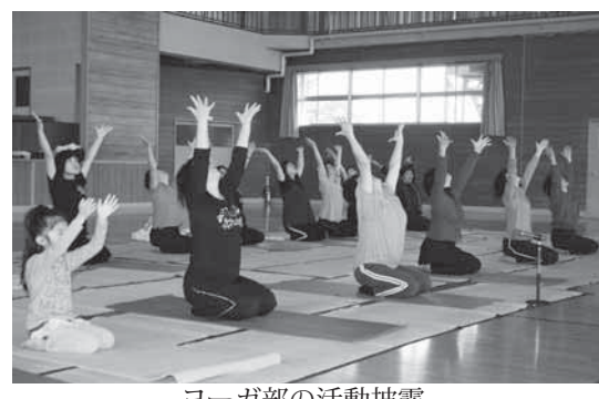
ヨーガ部の活動披露

多くの方に心身のリフレッシュをしていただくことと昨年に引き続き町体育協会が企画したもので、約150名の方が参加しました。 第一部の『体協加盟団体による活動披露・体験コーナー』では、ヨーガ部、自強術部、健康体操部、3B体操部の皆さんが、日頃活動している内容を皆さんに披露しました。 第二部では、福島学院大学生による『アンサンブルとYOSAKOIの公演』が行われ、アンサンブルクラブ「Ars」(アルス)の皆さんとYOSAKOIクラブの皆さんが息のあった演技を披露し、観衆を魅了しました。 参加者は「ひまわり」のような笑顔で楽しいひと時を過ごしました。