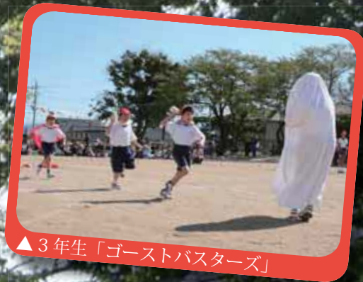
▲3年生「ゴーストバスターズ」