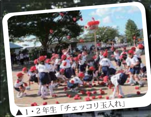
▲1・2年生「チェッコリ玉入れ」