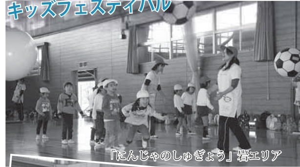
「にんじやのしゅぎょう」岩エリア