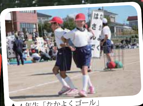
▲4年生「なかよくゴール」