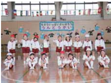
最後の運動会となった森江野幼稚園の園児たち (4・5面に関連記事)