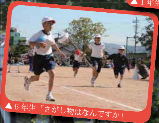
▲6年生「さがし物はなんですか」