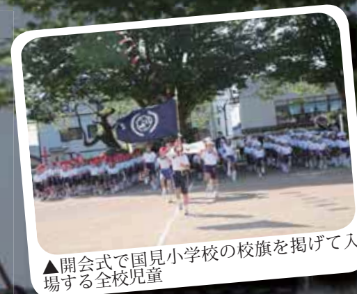
▲開会式で国見小学校の校旗を掲げて入 場する全校児童