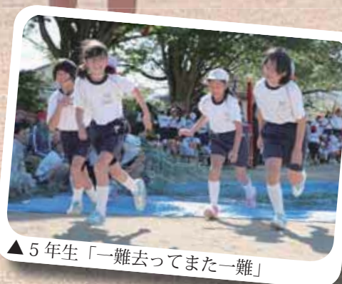
▲5年生「一難去ってまた一難」