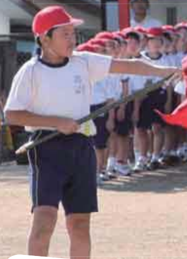
開会式で統合した5つの小学校の 校旗を披露する児童達