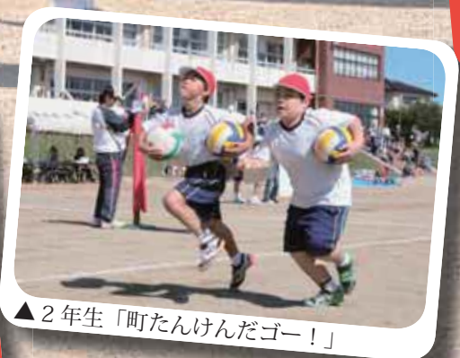
▲2年生「町たんけんだゴー！」