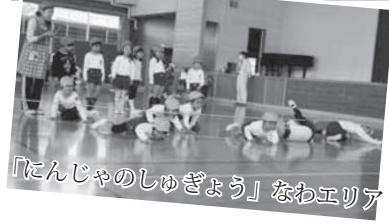
「にんじやのしゅぎょう」なわエリア

平成 25 年 4 月からの幼稚園統合に向けて、町内の幼稚園・保育所の子どもたちが一緒に交流する「キッズフェ