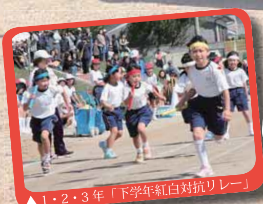
▲1・2・3年「下学年紅白対抗リレー」