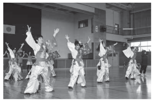
福島学院大 YOSAKOI クラブの演技