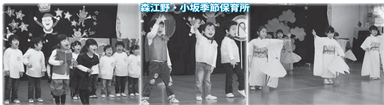
森江野・小坂季節保育所