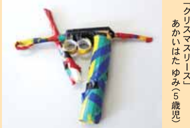
「クリスマスリース あかいはたゆみ（5歳児）」