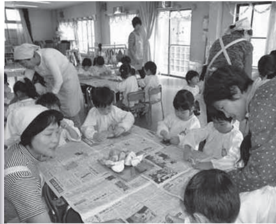
森江野季節保育所での様子

現在11名が活躍中です。食生活や健康づくりに興味のある方を随時募集しています。 (お問合せ・お申し込みは保健福祉課 保健係まで) ☎ 585 - 2783