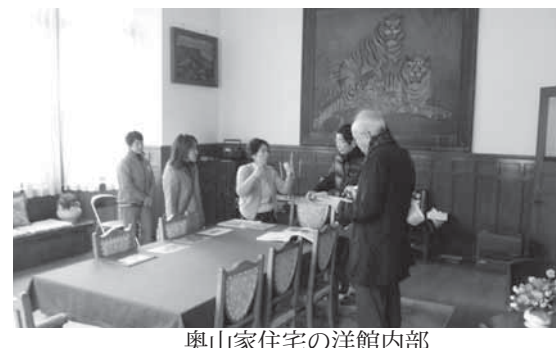
奥山家住宅の洋館内部

大正建築の美に触れた「奥山家住宅」文化財公開デー 国登録文化財「奥山家住宅」文化財公開デーを、12月8日に町文化財ボランティア・奥山合名会社の協力を得て開催しました。 奥山家住宅は、大正時代に建てられた商家の屋敷です。震災により被災した主屋・洋館の修繕工事が10月末に完了し、震災後初めての公開となりました。 見学者は、洋館と主屋の漆喰の壁や彫刻・調度品の数々に感心し、当時の職人技術や大正期の優雅な生活