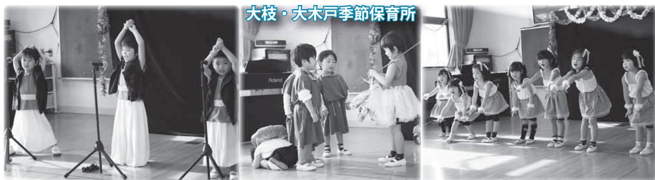
大枝・大木戸季節保育所