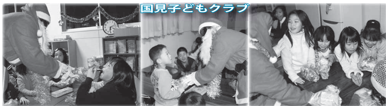
国見子どもクラブ