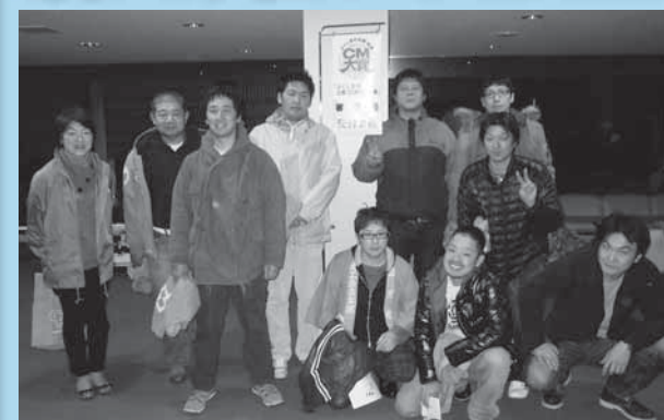
審査会に参加した町商工会青年部員のみなさん

KFB福島放送主催の「ふくしまの元気!応援CM大賞」に国見町では、町商工会青年部員が制作した町をPRする作品「ピーチピチ国見パートIV」を応募しました。