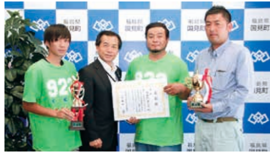
太田町長に優勝報告する青年部のみなさん