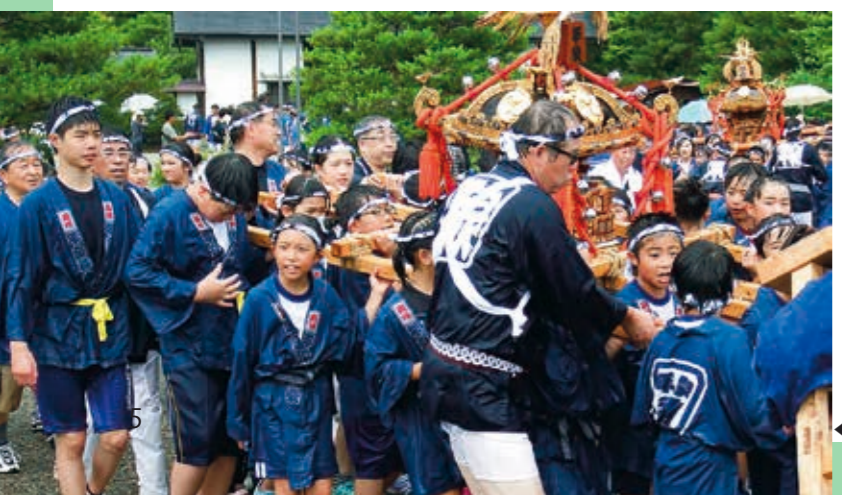
◀水かけ神輿に参加する国見ジュニア応援団

オープン以来、県内外から多くの方に来場いただいている「道の駅国見あつかしの郷」。今後もより多くの人に愛される道の駅を目指し、着実に歩みを進めます。