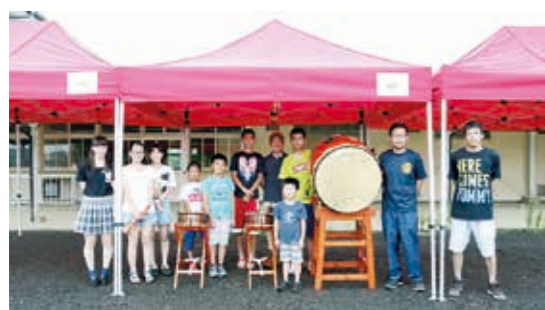
太鼓の練習がんばります！