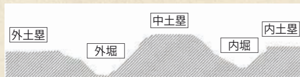
阿津賀志山防塁の断面イメージ図

4本の試掘で、堀と土塁の痕跡を確認し、800年前の合戦に使われた当時の様子が明らかになりました。堀は、幅4.2m、現地表面からの深さ1.8m。土塁は、幅7.2m、堀底からの高さ3.4mを誇ります（2号トレンチの成果）。外堀は、堀底にかけて斜面が急角度になり、這い上がることが難しい形状であることが分かりました。東北を守るための戦いに備え、防衛性を高める工夫がなされています。