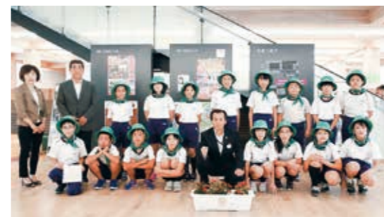
みんなで大切に育てました

県北中学校で行われた啓発活動には生徒会役員のみなさんも参加し、登校する生徒にパンフレットなどを配りながら、地域と学校が一体となって犯罪や非行の防止を呼びかけました。