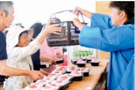
道の駅でモモを買い求める来場者