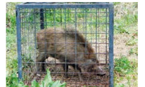
近年はイノシシによる被害も多発

会議では鳥獣被害の現状と課題や効果的な被害防止対策などについて協議し、委員からは町鳥獣被害対策実施隊員の育成についても意見が出されました。町は今回の協議内容を今後の対策に生かし、鳥獣被害防止の取り組みを推進していきます。