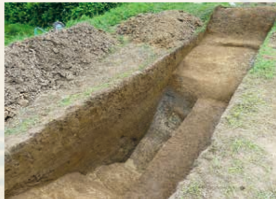
◀試掘された外堀と土塁