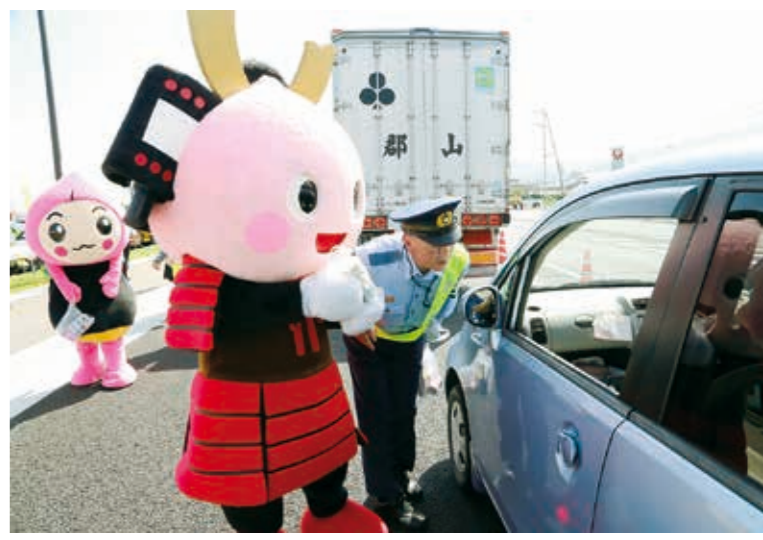
ドライバーに安全運転を呼びかけ ふくしま・みやぎ 県境キャンペーン

宮城県白石市と国見・桑折地区合同の「夏の交通事故防止ふくしま・みやぎ県境キャンペーン」が7月19日、道の駅国見あつかしの郷で行われました。キャンペーンには太田久雄国見町長、牧野善茂桑折町副町長、菊地正昭白石市副市長をはじめ、警察関係者、管内の交通安全団体関係者が参加。また、「くにももたん」や桑折町の「ホタビー」、白石市の「ポチ武者こじゅーろう」と甲冑工房「片倉塾」のみなさんも駆けつけ、キャンペーンを盛り上げました。道の駅では初の開催。開催地を代表して太田町長が「両県の交流の場となるこの道の駅はキャンペーンにうってつけの場所。連携して交通事故のない安全・安心のまちを目指しましょう」とあいさつしました。