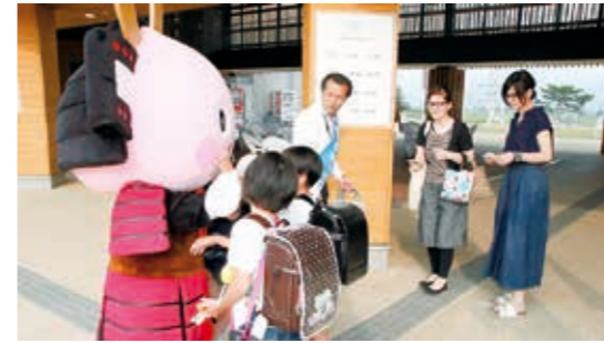
くにみももたんも呼びかけに協力しました