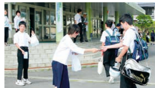
啓発活動に参加する生徒会役員のみなさん

来場者からは「小さい子どもと一緒に聴けるクラシックは珍しく、楽しめました」との声が多く聞かれ、大好評でした。