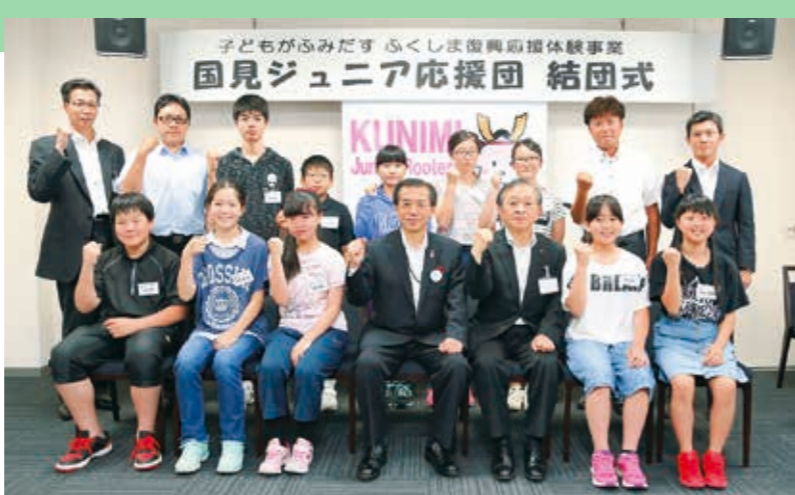
国見町の元気を発信します！