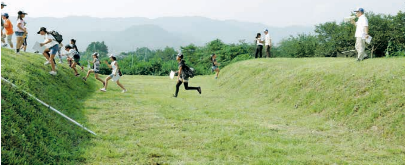
あつかしやまぼろい しもふたえぼり 阿津賀志山防塁 (下二重堀地区)

阿津賀志山防塁は、文治5年(1189年)に奥州藤原氏が源頼朝を迎え撃つため、阿津賀志山の中腹から3.2kmにわたって築いた要塞です。その中でも、この下二重堀地区は、2本の堀と3本の土塁の遺構が良くわかり、町の歴史を散策する町内外の方々に親しまれています。