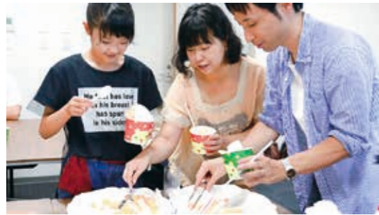
“モモのかき氷”を楽しむ親子

大会は7月13日に月舘運動場で開催され、9チームがソフトボール競技で熱い戦いを繰り広げました。国見町商工会青年部は持前の団結力で見事4連覇を達成しました。