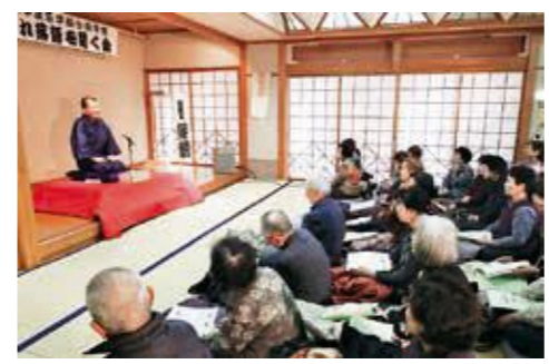
おあとがよろしいようで

3学級合同学習「年忘れ落語を聞く会」が12月15日、観月台文化センターで開催され、約80名が参加しました。 昨年に続いて「ふくしま素人落語の会」の7人が出演し、昨年とは異なる新しい落語を披露しました。学級生の顔も覚えられ、嘶の枕には町の様子や学級生の事を話題に取り上げ、笑いを誘っていました。参加者は、笑顔で一年の講座