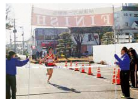
チームのタスキをつないで完走!

第36回伊達地方一周駅伝競走大会が12月3日、川俣町から伊達市保原町までの49・9kmのコースで開催されました。