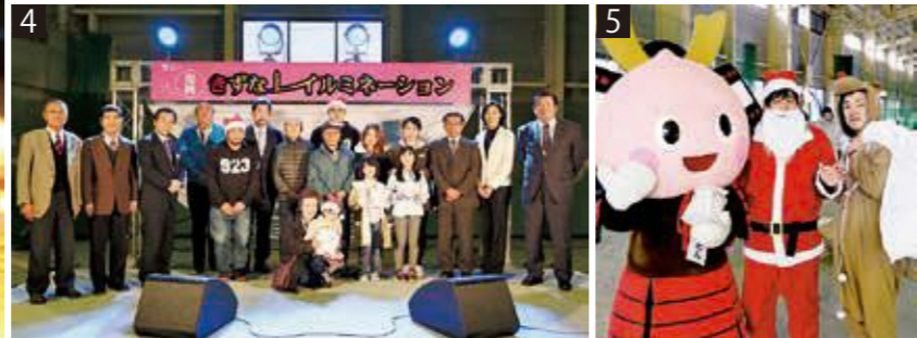
1 夜空を彩るビッグツリーと花火 2 キャンドルで描かれたくにももたんと道の駅 3 キャンドルにあかりを灯す子どもたち 4 イルミネーション受賞者のみなさん 5 よい子のみんなにはサンタさんからプレゼント♪