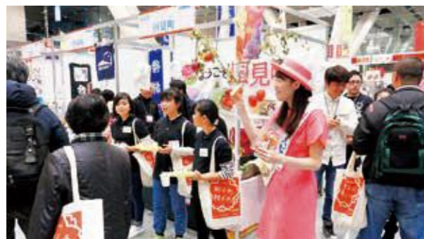
生産者、ミスピーチらとともにPRするジュニア応援団

国見ジュニア応援団は12月3日、東京国際フォーラムで開催された「町イチ！村イチ！2017」に参加しました。