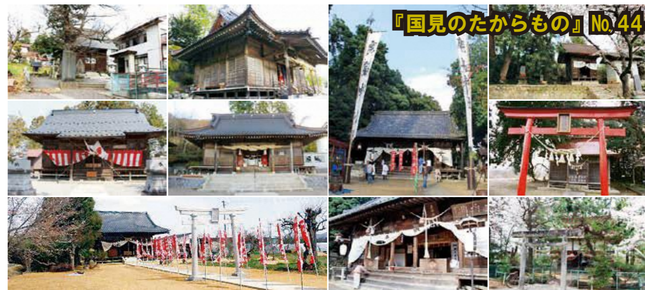
『国見のたからもの』No.44