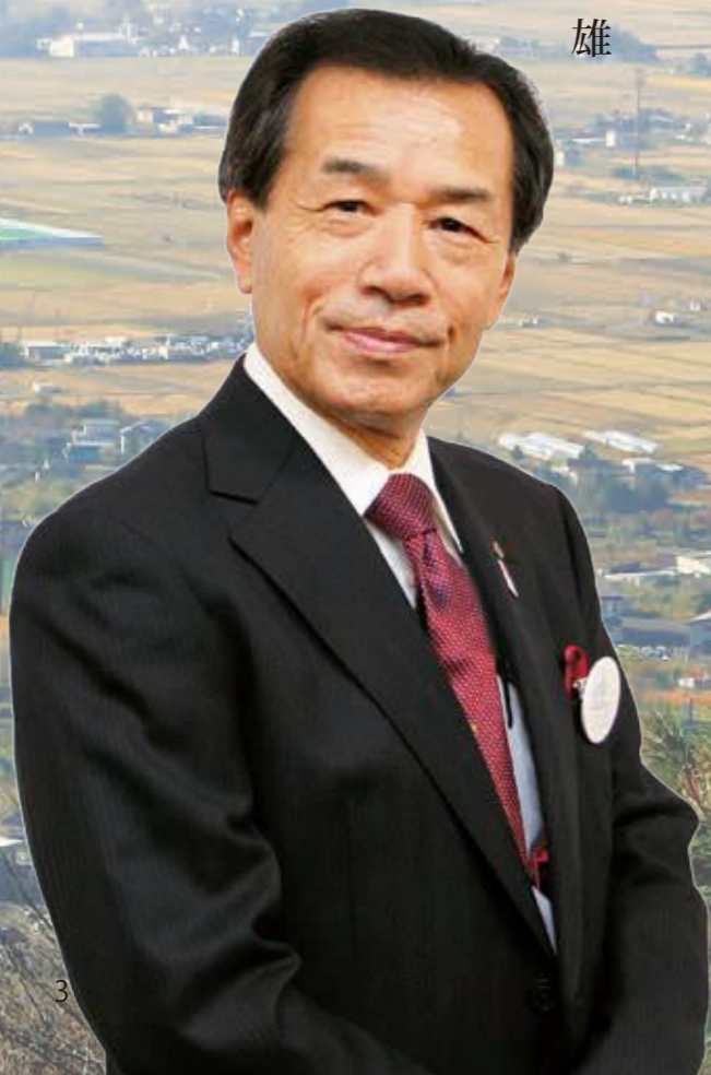
写真：阿津賀志山の山頂から信達平野を望む