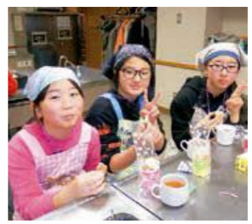
おいしくできたよ!

コーナーでは、「ハート型の小物作り」や今年の干支にちなんだ「スヌーピーの絵馬づくり」に真剣な表情で挑戦していました。子どもたちは地域のみなさんとの楽しい交流のひとつを過ごしました。