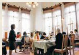
▲大正ロマンの洋館で憧れの茶会

家本来の魅力を活かした取り組みで、参加者からは、「素晴らしい洋館で楽しいお話を聴けて感動した」「至福の時を過ごせた」との声が聞かれました。