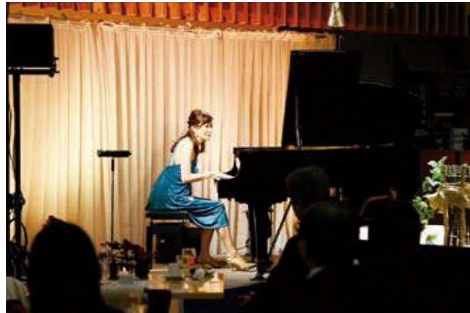
道の駅で優雅なひとときを