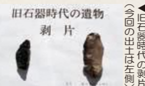
旧石器時代の遺物 剥片（今回の出土は左側）

いずれも町内における本格的な発掘調査では初めての発見で、町の歴史を考える上で貴重な資料となります。