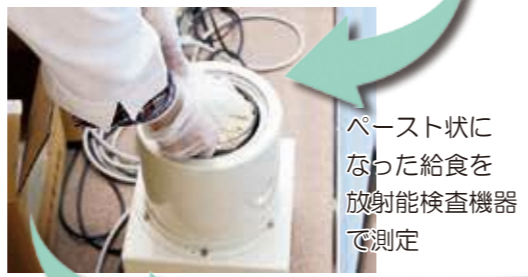
ペースト状になった給食を 放射能検査機器で測定