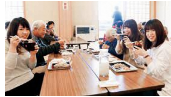
小坂産の“十割そば”を楽しむ来場者

国見ミニバスケットボールスポーツ少年団は12月23日、団員29人と保護者が協力して上野台体育館の清掃を行いました。清掃は、1年間練習でお世話になった体育館に感謝を込めて毎年行っているもので、6年生が中心となり体育館の雑巾がけやトイレ、ロッカー室などを隅々まで清掃しました。きれいになった体育館で、新年から気持ちを新たに練習に励みます。