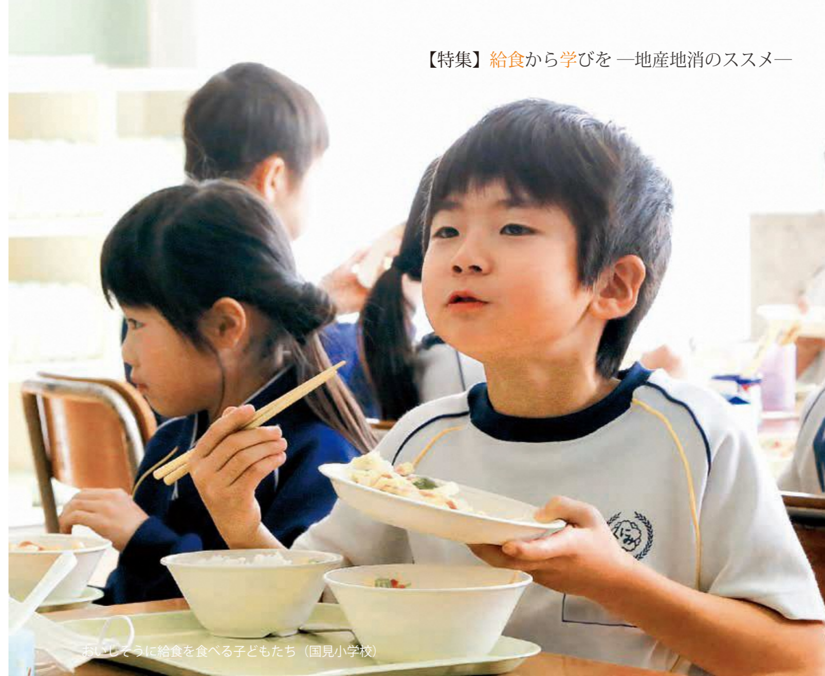
おいしそうに給食を食べる子どもたち（国見小学校）

また、夜には道の駅国見あつかしの郷に会場を移してディナーコンサートが開催されました。来場者は、木住野さんが奏でる美しい音色とレストラン桃花亭のシェフ自慢の料理との“共演”を楽しんでいました。