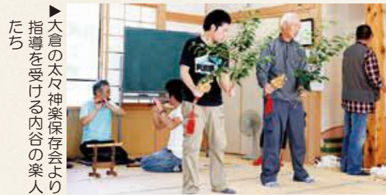
▲大倉の太々神楽保存会より指導を受ける内谷の楽人

内谷の神楽は、明治15年に三春地方から伝わった出雲流神楽です。現在、継承が途絶えている8座について、伝承された地方の「大倉の太々神楽保存会」（田村市船引町）との交流を図り、演目を復活させる取り組みを行っています。