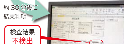
約30分後に 結果判明 検査結果 不検出