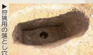
▲狩猟用の落とし穴