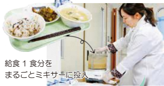
給食1食分を まるごとミキサーに投入

そうした状況下で地産地消の取り組みを進めるためには、学校や保護者のみなさんの絶対的な信頼と理解が必要です。子どもたちに安全・安心な給食を提供することを最優先としたうえで、地場産物の積極的な活用を目指して町が取り組ん