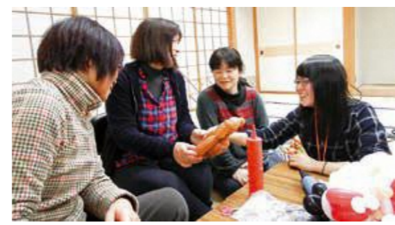
和気あいあいとバルーンアートに挑戦

一芸講座が12月1日、7日、15日の3日間にわたって観月台文化センターで開催され、講座生8名がジャグリングやバルーンアートを体験しました。 福島大学ジャグリングサークル「JUGLUB」のみなさんによる丁寧な解説と指導のもと、難しそうな技や作品に挑戦。苦戦しながらも、笑いを交えながら楽しく学び、見事に「芸」を完成させました。