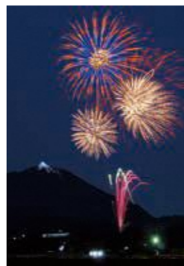
あつかし山ビッグツリーの点灯には、季節外れの花火が華を添えます。年の瀬・年初めの国見町はツリーのやさしい光に包まれました。