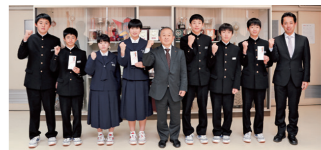
▲奨励金を手に大会での活躍を誓うみんな▼