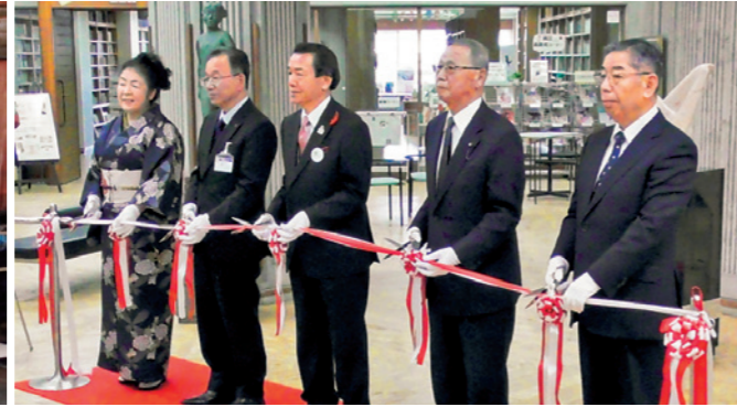
テープカットでフェスタが開幕しました