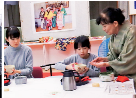
親子で茶道の基本を学んでいます