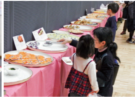
地元食材を使った郷土料理は大好評