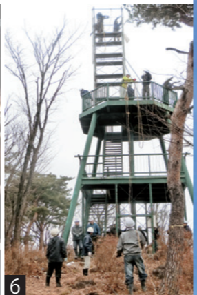
1 夜空を彩るビッグツリーと花火 2 エキゾチックな音楽を奏でた熊谷陽子 with ふくしまボトムズ 3 子どもたちにサンタさんからプレゼント 4 イルミネーション表彰式 5 ビッグツリー点灯 6 町建設業組合と管工事組合のみなさんによるビッグツリーの設置作業

明 けましておめでとうございませう。謹んで新年のごあいさつを申し上げます。 はじめに、昨年10月の台風第19号で被災されました皆様にご心よりお見舞いを申し上げます。 昨年は、新たな元号「令和」が幕開けした記念すべき年となりました。10月はラグビーW杯がアジア初の日本で開催され、日本代表が予選ラウンド全勝で初めて決勝トーナメントに進出するなど大活躍し、日本中が熱狂しました。また、11月は野球のプレミア12で日本代表が見事「優勝」するなど、団体競技で目覚ましい活躍があり、改めてチーム内での「連携」の大切さを感じました。その一方、1月に熊本で震度6弱、2月に北海道で6弱、6月に新潟で6強、9月に台風第15号が首都圏を直撃、そして10月に台風第19号が東日本を縦断し、甚大な被害をもたらすなど、広域かつ大規模な自然災害に見舞われた年でもありました。