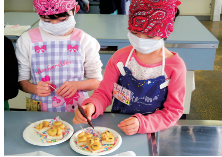
おいしいおやつできるかな

国見つ子わんぱく広場の活動が11月30日、国見小学校で行われ、子どもたちがプラ板づくりとおやつづくりを体験しました。 プラ板作りでは、自分の好きな絵を描いてプラスチックのキーホルダーにして、友達同士で自慢しました。 おやつづくりでは、キャラメルバナナトーストづくりに挑戦し、甘くておいしいおやつを味わいました。