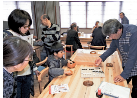
興味深く囲碁のルールを勉強