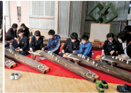
中学生も碁の講師を務めました