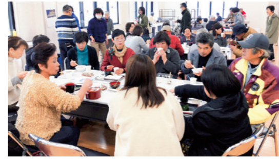
小坂のそばに舌鼓を打つ来場者

国見ミニバスケットボールスポーツ少年団の団員17名とその保護者が12月21日、上野台体育館の清掃を行いました。この取り組みは、練習で使用している体育館へ感謝の気持ちを込めて毎年行っているものです。団員の子どもたちに感想を聞くと「掃除は大変だけど、すっきりした」との声のほかに「一緒にバスケットをする仲間を募集中」との声も。