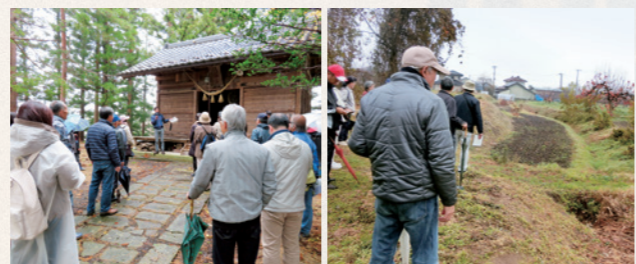
雨乞いの前の晩にお籠りした八幡神社 塚野目城跡の喰い違い土塁跡