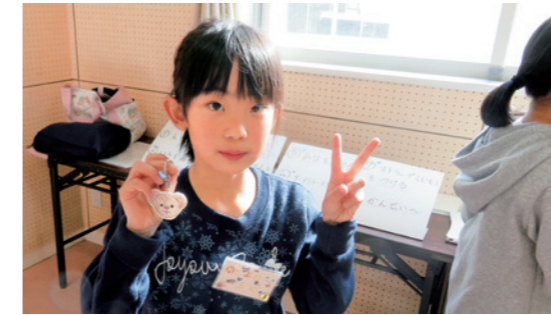
オリジナルのキーホルダー完成