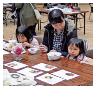
郷土料理に舌鼓を打つ親子

私たちにとっても良い体験になりました。親子連れが喜んで料理に舌鼓を打ち、「今度はこれを食べてみよう」「お母さん、お家でも作ってね」と、うれしい言葉をいただきました。