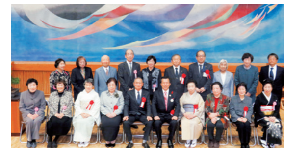
みんな笑顔で記念写真