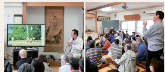
解説を聞きながら映像を観賞 当時の参加者の話

町内の参加者も、35年前の雨乞い祈願がどのように行われたかを知らない人が大多数で、「どんなことをしたのかが分かってよかった」「10月に国見町で発生した自然災害の記憶も、風化させることなく後世へ伝えていくことが大切だ」といった声が聞かれました。