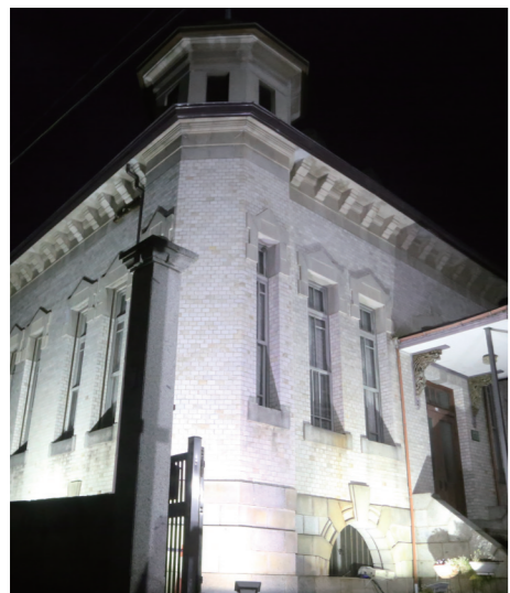
ライトアップした奥山家住宅洋館

広報くみに掲載された写真を希望する方は、総務課文書広報係 ☎ 585-2113 まで連絡ください。