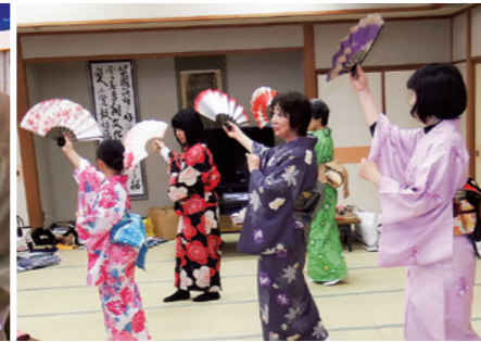
優雅で美しい踊りを体験