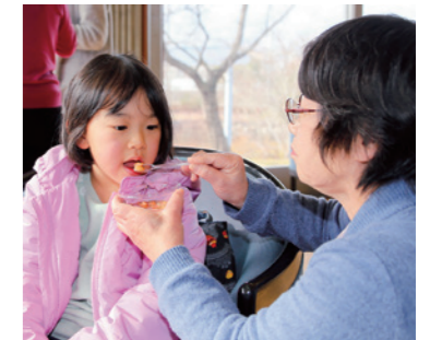
試食ではおいしい減塩料理に大満足

近年、町の特定健診の結果において、高血圧及び血糖関連項目の有所見率が高く、生活習慣病の増加が懸念されています。町では、みなさんに元気でいきいきと長生きしていただくために減塩生活の推進に取り組んでいます。その取り組みの一環として今年度2回目の減塩セミナーを開催しました。