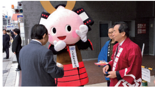
町特産のあんぼ柿をPR