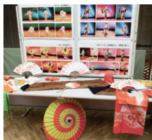
着物や扇子の展示

興味を持った方が多くありがたかったです。来てくれた子どもたちも楽しんでくれていました。着物や扇子などの展示も好評でした。