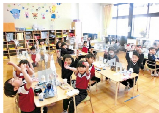
おいしいイチゴをありがとうございます!!

後日、おいしいイチゴを食べた園児たちから、手作りの感謝状がふくしま未来農業協同組合へ送られました。