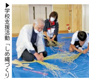
▶学校支援活動「しめ縄作り」

コロナ禍により講演日が延期となりましたが、200名を超える参加者はテレビとはまた一味違う生の天達さんの言葉に聞き入り、元気をいただいたと感激していました。