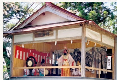
神楽奉納 演目「猿田彦」