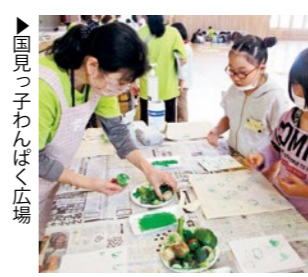
▶国見っ子わんぱく広場