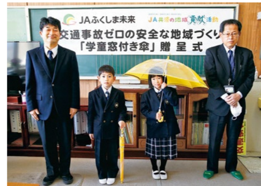
寄贈された学童窓付き傘をもつ生徒たち（中央）

ふくしま農業協同組合は、管内の子どもたちに向けて「農業のため・地域のため・明日のため」を実践する活動を展開。新1年生が交通安全への理解を深めるためのきっかけとなることを目的として学童窓付き傘を制作し、地域貢献活動の一環として今回の寄贈を行いました。