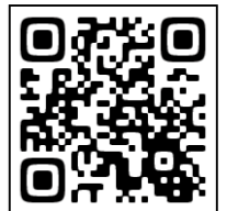
▲公式 Facebook はコチラ

活動の様子は、公式 Facebook でも発信していきますので、ぜひお楽しみに!