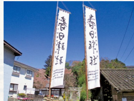
内谷春日神社入口