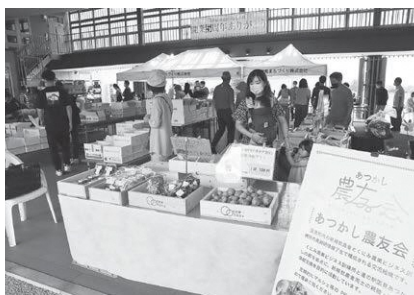
あつかし農友会が参加した道の駅マルシェ