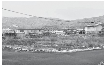
駅前開発が待たれる町有地

課長 官民連携により、子育て住宅を建設した。また大坂団地リノベーション事業により新しい働き方に対応できる場の創出にも取り組んでいる。