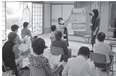
マイナンバー出張申請受付

住民防災課長 病気や身体障害等により手続が難しい方は、代理人による申請や、要請があれば職員が出向いて対応することも可能である。