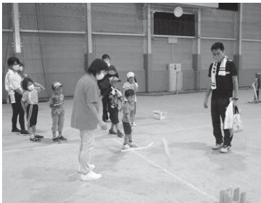
9月に実施されたプレ事業の様相(写真の競技はモルック)