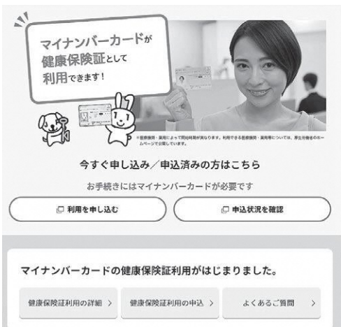
マイナンバーカードと保険証が一体化

ほけん 課長 高齢者や基礎疾患のある方には、かかりつけ医や公立藤田総合病院または北福島医療センターを案内している。家族で陽性者が出