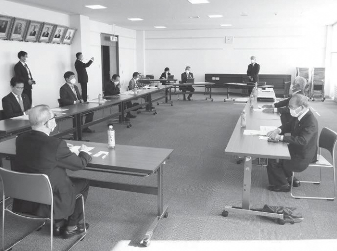
行政調査の様子(写真は沼田町議会)