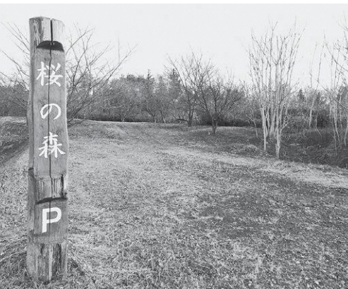
桜の森 駐車場入口

に森林委員会を3回開催し協議してきた。整備をするかどうか、あるいはどのような形がいいのか。賃貸借期間があと4年4ヶ月残っているの、その後どうするのか、そのを総合的に森林委員