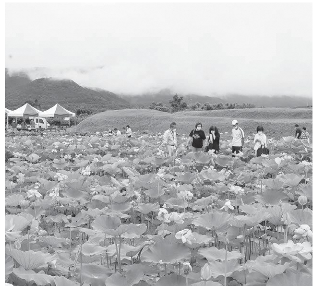
大勢の来場客でにぎわうくみ蓮まつり

町は保健福祉課とも検討すると答弁だった。本件について現在の状況をお聞きしたい。 ほけん 課長 父子手帳の発行については考えていない。父親の育児参加への意識が高まっているので、母子手帳と副読本、子育て応援ガイドブック「のびのび」の発行により、必要な知識、心構え等が得られると考えている。