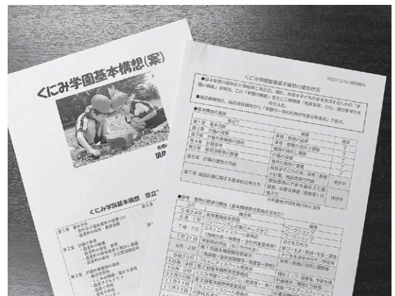
くにも学園構想の資料

学校には、普通教室以外に特別支援の教室、理科や音楽等の特別教室、さらには図書室、会議室、多目的