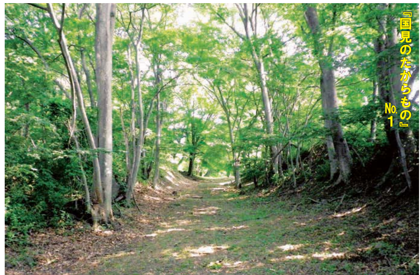
『国見のたからもの』 No.1

今年初めて、自分たちの「まち」の再確認、再発見で始まったふるさと祭。 自分の「まち」の歴史・伝統・文化といった地域の宝を受け継ぎ、その良さを実感することができた1日になりました。 また、国見町の良さ、人と人、人と地域のつながりや思いやりを再確認することができました。今後、より良い国見町をみんなで築いていくための大事な1日になりました。