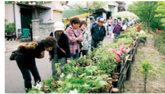
お気に入りの一鉢

5月3日、保原高校美術部員29人が、大木戸にある飯館村の仮設住宅の壁面に村の鳥のうぐいす・花のヤマユリなど絵を描きました。この活動は、以前から保原高校が行っている「がれきに花を咲かせようプロジェクト」の一環で壁画制作活動は11回目と、訪問した仮設住宅は今回で4ヶ所。入所者は生徒に声を掛けながら作業を見守っていました。