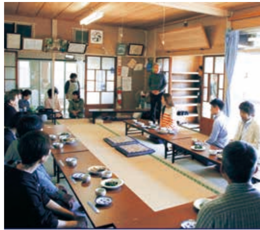
地域の伝統活動と歴史を学ぶ (鳥取福源寺)

国見町は、福島大学、桜の聖母短期大学、東海大学と連携し、大学の専門性と学生の若い力で、町の活性化や人材育成を目指します。