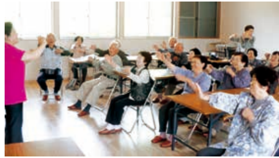
みんなで笑顔でいきいきサロン