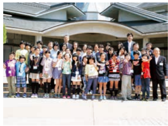
笑顔あふれる教室生