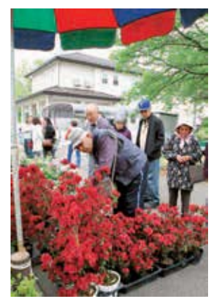
5月5日の農業市での一コマ。お天気も良く、多くの方がお気に入りの一鉢を買い求めていました。