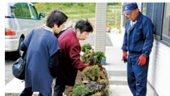
今年も地域で盛り上げます

5月10日、公立藤田総合病院で健康フェスタが開催されました。フェスタには、健康相談、健康指導が受けられることもあり、毎年多くの方が来場されます。今年も、町の地域包括支援センターの相談ブースや上下水道課のブースも初めてでました。また、内視鏡を使つての鉛とりゲームには多くの子どもたちが参加し、真剣なまなざしで操作をおこなっていました。