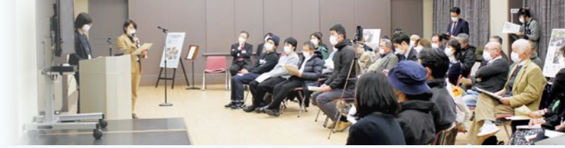
▲1月13日に開催された中間報告会の様子

現在、くみにみ学園整備の土台となる基本構想の策定を進めていますが、学園整備の「めざす姿」や建設候補地を説明する中間報告会を1月13日に開催しました。構想素案の主な内容をお知らせします。