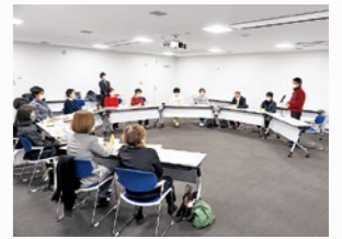
▲第1回検討委員会の様子