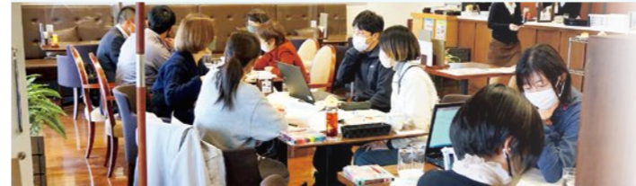
▲1月26日に開催された第2回検討委員会の様子