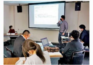
▲第2回検討委員会の様子