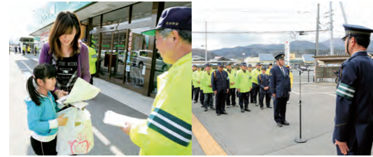
交通事故防止啓発

4月6日から15日の10日間、春の全国交通安全運動が実施されました。「事故のない 明るい未来は 君の手で」をスローガンに「子どもと高齢者の交通事故防止」を運動の基本として、交通事故防止を訴えました。