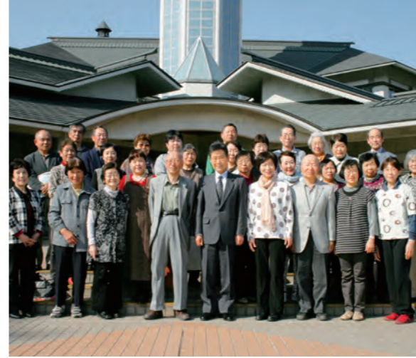
「健康で元気に」スタートした成人学級生