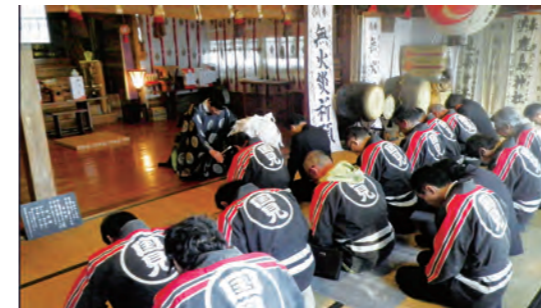
町内の無火災を願って

3月27日、JA伊達みらいふれ愛グループさくら会が、町内に住む76歳以上の一人暮らし、81歳以上の二人暮らしの高齢者世帯にお弁当の配達を行いました。さくら会の宅配ボランティアさんが一軒一軒まわり、言葉を交わしながらお弁当を渡しました。皆さん「ありがとう」「待っていたよ」と笑顔でお弁当を受け取りました。