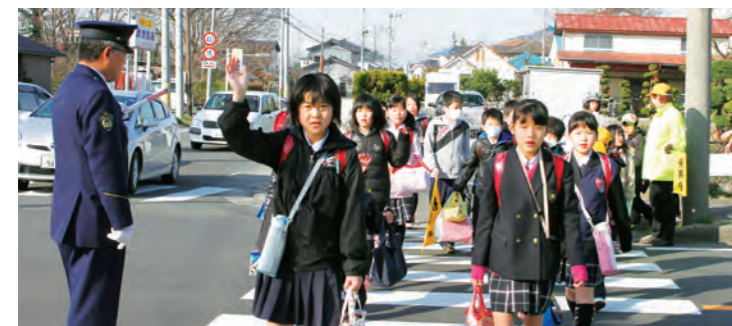
みんなで交通安全守ります