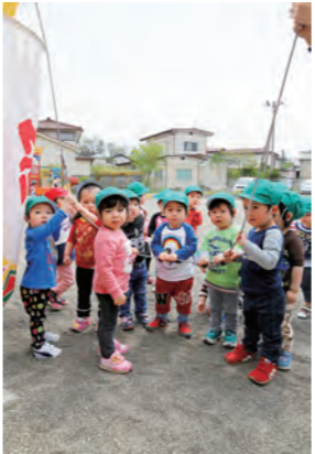
藤田保育所の園児と一緒にこいのぼりを揚げてきました。なかなか揚がらないこいのぼりに園児は、声をかけながらみんなで頑張り、こいのぼりを泳がせることができました。