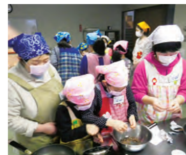
お菓子を使った料理に挑戦

3月28日、開催した家庭教育応援講座「春休み親子クッキング教室」では、親子9組(25人)が参加して、明治クッキングサロン栄養士から、乳製品を使った料理の指導と食育について話を伺いました。 「トルティヤ」づくりではお菓子のカールを細かく砕いて生地に混ぜ込んだり、またデザートは「ティラミス」づくりでは、板チョコを砕いたり、生クリーム