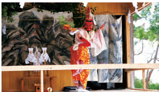
無形民俗文化財の太々神楽

○未来へのまちづくり・人づくりへ この計画策定の中で、国見町の生い立ちや歴史と人々の暮らしまで掘り起こし、国見町に住む私たちの「誇り」を確立することも可能です。そして私たちの住む国見町にさらなる魅力が加わり、輝きを増すよう策定を進めます。