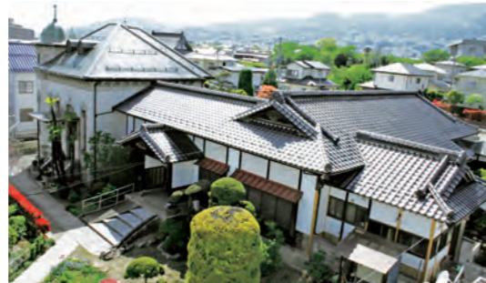
国登録有形文化財の奥山家住宅

○歴史まちづくり計画（歴史的風致維持向上計画）とは 平成20年に施行された「地域における歴史的風致の維持向上に関する法律（略称：歴史まちづくり法）」に基づく計画です。 この計画は国が認定するもので、法律上の特例措置や各種事業による支援が受けられます。東北では弘前、鶴岡、多賀城、白河の4市が認定されています。