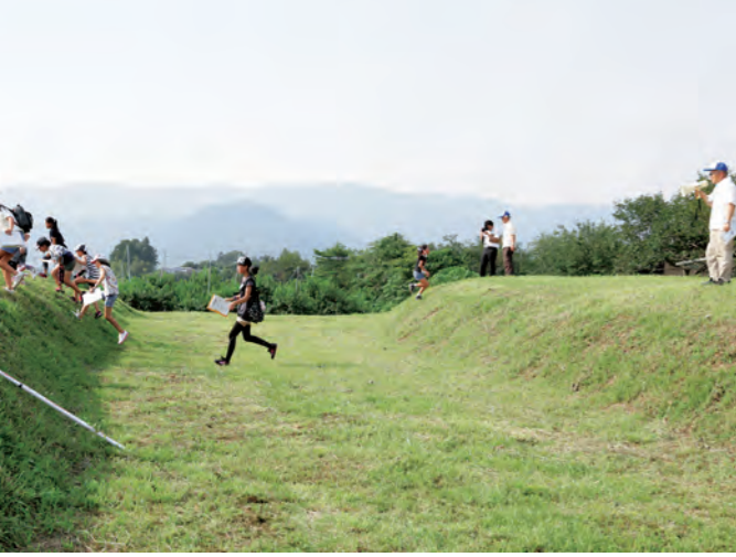
国の指定史跡「阿津賀志山防塁」