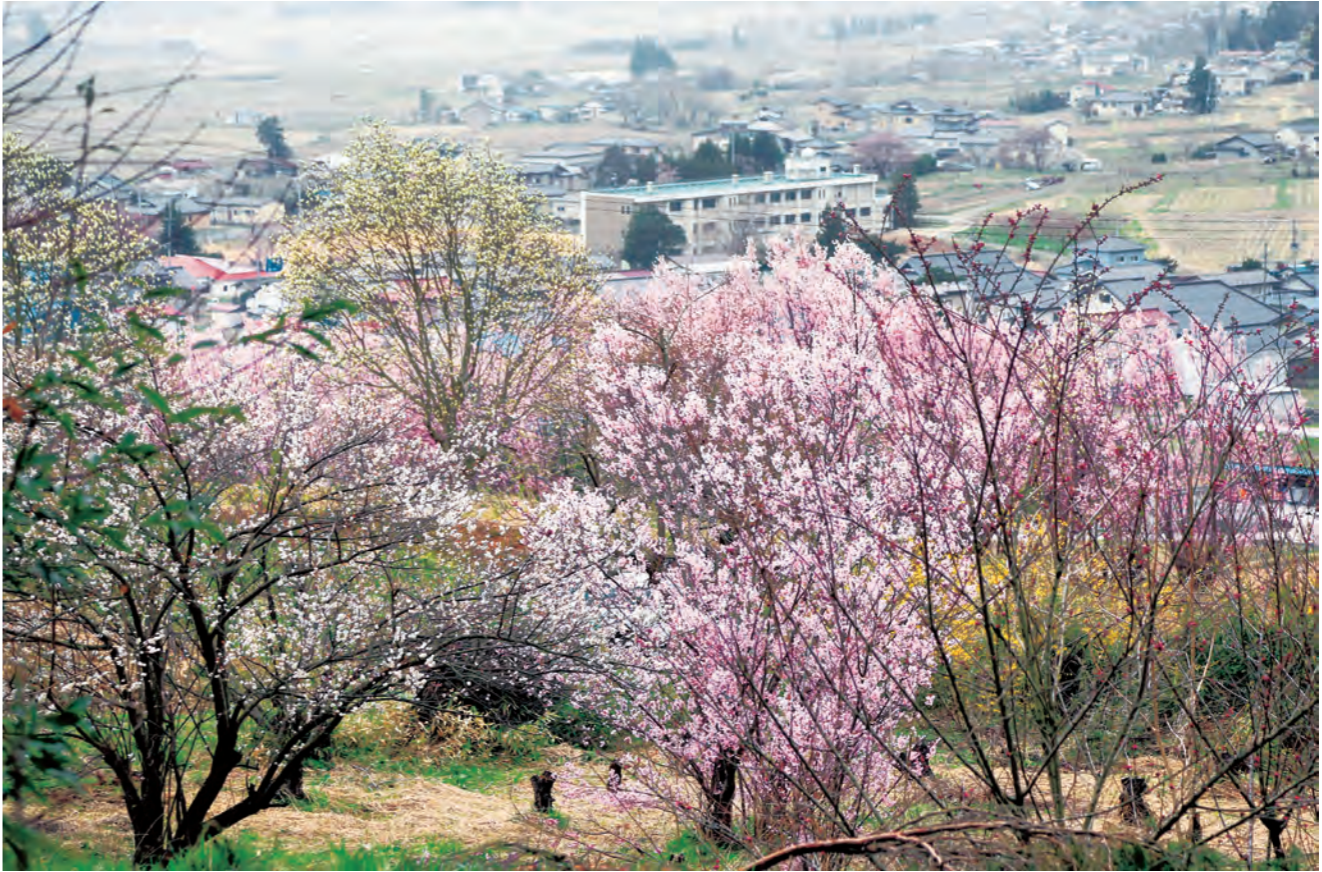
内谷から見渡すことのできる小坂地区