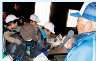
文化財ボランティアの説明を聞く国見小児童