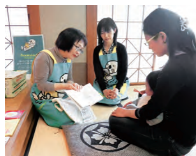
初めての絵本を手渡すブックスタート

町では、平成17年より町内在住の乳児と保護者を対象に3か月児健診の待ち時間を利用して、子ども移動図書館指導員が赤ちゃん絵本の紹介と絵本の読み聞かせの実演を行っています。 絵本を介して大人からのやさしい言葉かけが赤ちゃんの言葉と豊かな心を育み、さらに赤ちゃんの向き