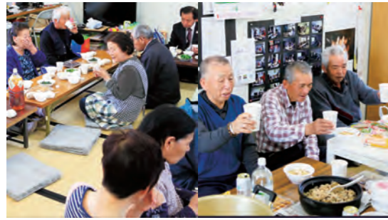
上野台仮設 大木戸仮設