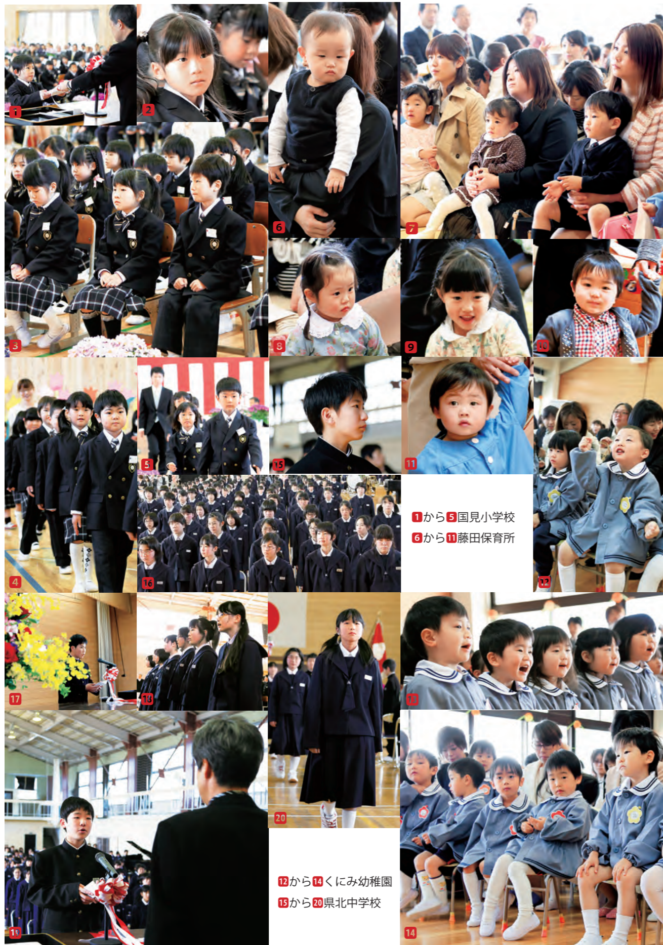
1から5 国見小学校 6から11 藤田保育所