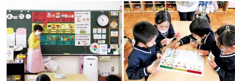
年長児：バランスよく食べよう!①

町では食生活改善推進員の皆さんと栄養士が、くにみ幼稚園の子どもたちを対象に食育教室を開催しています。2月は右記の内容で実施しました。