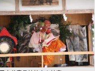
■内谷春日神社太々神楽

内谷春日神社では、祭礼で奉納される太々神楽が明治15年(1882)より地区の人々の協力により継承されています。社殿に響く太鼓と笛の音色が、地区の伝統芸能と祭礼のにぎわいを伝えています。