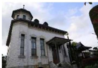
■国登録有形文化財「奥山家住宅」