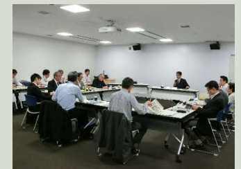
● 歴史文化基本構想策定委員会