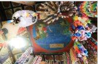
■福源寺観音堂の天井絵

鳥取集落では、福源地蔵庵観音堂を観音講の人々が守り、巡礼者へのもてなしや法会が行われています。観音信仰が地域に根付き、鳥取集落の人々により活動が続けられてきています。