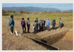
■顕彰・教育活動(案内活動)

阿津賀志山とともに本町のシンボルである「阿津賀志山防塁」は、合戦が行われてから800年間、人々により守られてきました。現在も顕彰・教育活動が行われ、町民が共有する誇りと町の歴史性を感じる場所となっています。