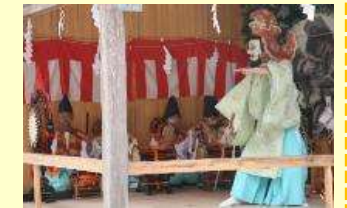
●内谷春日神社太々神楽

祭礼や神楽等の伝統芸能の活動内容の把握と映像による記録作成など、学術調査とともに、用具の修繕や活動の支援を行う。