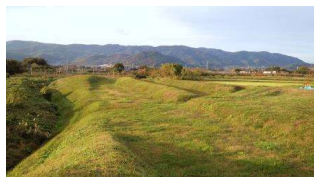
■国史跡「阿津賀志山防塁」(下二重堀地区)