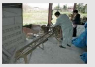
■現在も使われている石材加工場

国見石が産出する本町の特徴的な産業である石材業は、大正・昭和の歴史的な石蔵とともに守られています。土工技術により町内一円に建築された石蔵が、本町を特徴づける固有の景観となり残されています。