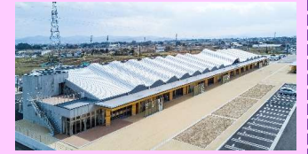
● H29.5オープン「道の駅国見あつかしの郷」

来町する人々が、歴史文化遺産に係る情報を容易に入手できる、エントランスの機能をもつ「道の駅」の整備を行う。