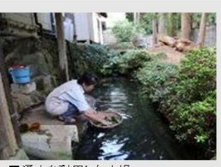
■湧水を利用した水場

光明寺集落では、清らかな湧水が伝統的な水利用と信仰に結びついています。湧水と信仰に伴う活動により清浄な空間が作り出され、現在も歴史的な寺社が残る聖域を形成しています。