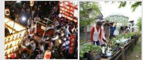
■鹿島神社例大祭(もみ合い) ■農業市

旧藤田宿では、山車と神輿が激しくぶつかる、もみ合いを特徴とする「鹿島神社例大祭」と、江戸時代に行われた六斎市の名残をとどめる「農業市」「だるま市」が現在も行われています。町並みの歴史と伝統を反映した活動が多くの人々により受け継がれています。