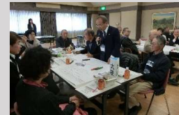
● 町民ワークショップ

歴史を活かしたまちづくりや町並み・景観の維持・向上に関して住民向けの講演会、ワークショップ、シンポジウムを開催する。