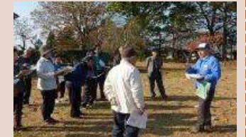
●案内ガイドの様子

町の歴史や人々の伝統的な活動や町並みと現在の国見町について語る事ができる人材の育成を図る。