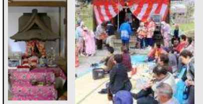
■観音堂 ■秋葉神社例大祭

宿場の名残と明治・大正期の歴史を色濃く町並みに残す旧貝田宿では、祭礼や最禅寺の観音講などが貝田の歴史を反映し、人々の絆を深める活動として行われています。