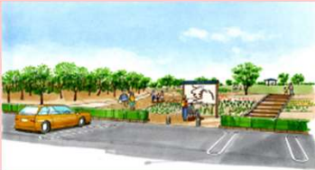
● 駐車場・園地等の整備イメージ図

阿津賀志山防塁の発掘調査・史跡の復原整備とともに、下二重堀・国道4号北側地区周辺に便益施設・ガイダンス施設を伴う歴史公園の整備、アクセス性向上のため町道改良を行う。