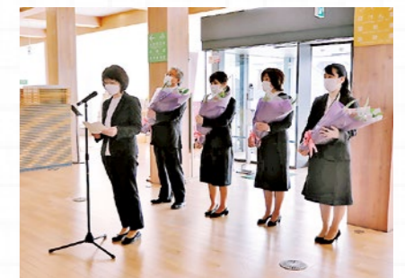
退職のあいさつをする東海林教育次長