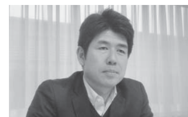
福島県立医科大学 臨床心理士