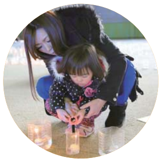
2人で力を合わせて点灯