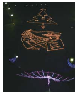
県北中学校美術部の 作品