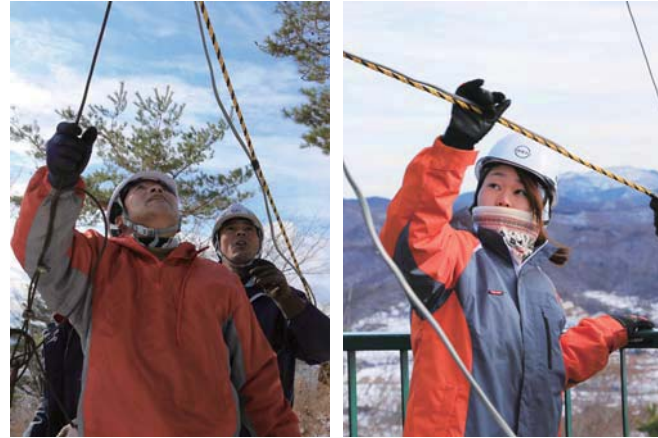
阿津賀志山での作業の様子