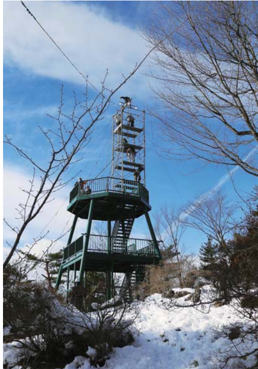
阿津賀志山の展望台にやぐらを組んで