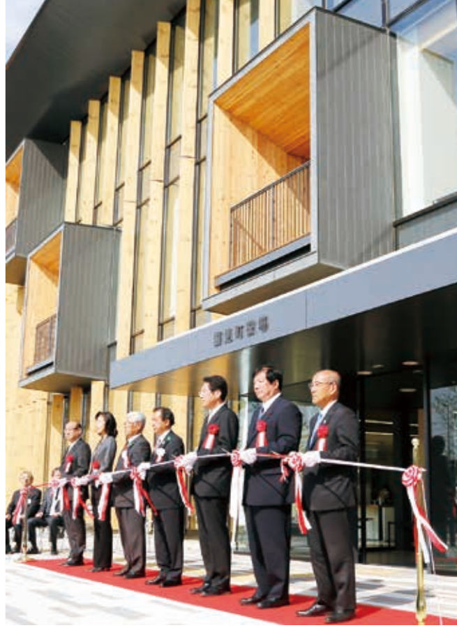
開庁式でのテープカット