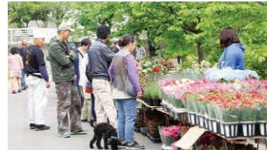
多くの人でにぎわう観月台公園

5月3日、国見ドリームクラブは上野台運動場で国見ソフトボールスポーツ少年団の子ども達へソフトボールを贈りました。ドリームクラブは社会貢献の一環として、公共施設の清掃などボランティア活動を積極的に行っており、今回、地元の頑張る子どもたちを応援するためにボールを贈りました。