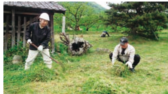
町の資源（たから）の美化活動

5月13日、イキイキ子育てクラブ開所式が藤田保育所内の地域子育て支援センターで行われました。クラブへの参加者は就学前の幼児と保護者で、今年度は15組35名のみなさんが参加しています。これからお絵かきや人形劇鑑賞などさまざまな活動を通して参加者同士の交流を深めていきます。引き続き参加者の募集もしています。