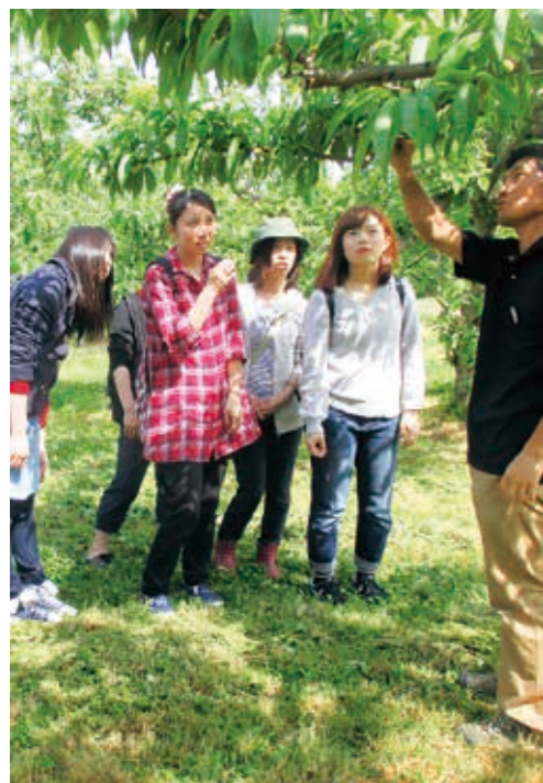
農業体験をする聖母短大のみなさん

学生たちは5つのグループに分かれてレシピを考案し、試作を重ね、7月末に町内の子どもたちの代表に試食をお願いすることになりました。町では試食会で好評なスイーツの道の駅での販売を目指します。