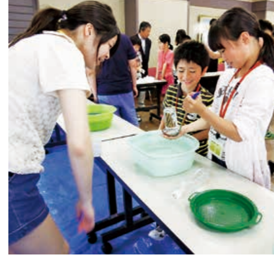
ボランティアに見守られながら楽しく活動