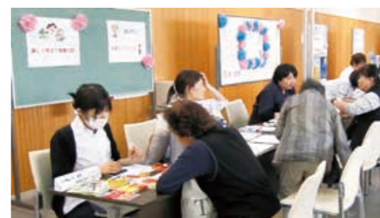
健康相談を受ける来場者

5月5日、恒例の農業市が観月台公園で行われ、町内外から多くの人を訪れました。当日は、農産物や苗木などを販売する56店舗が出店し、出店者との会話を楽しみながらお気に入りの苗木などを探していました。また、リニューアルした「くにみもたん」も登場し、会場を盛り上げていました。