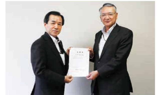
太田町長から委嘱状を交付