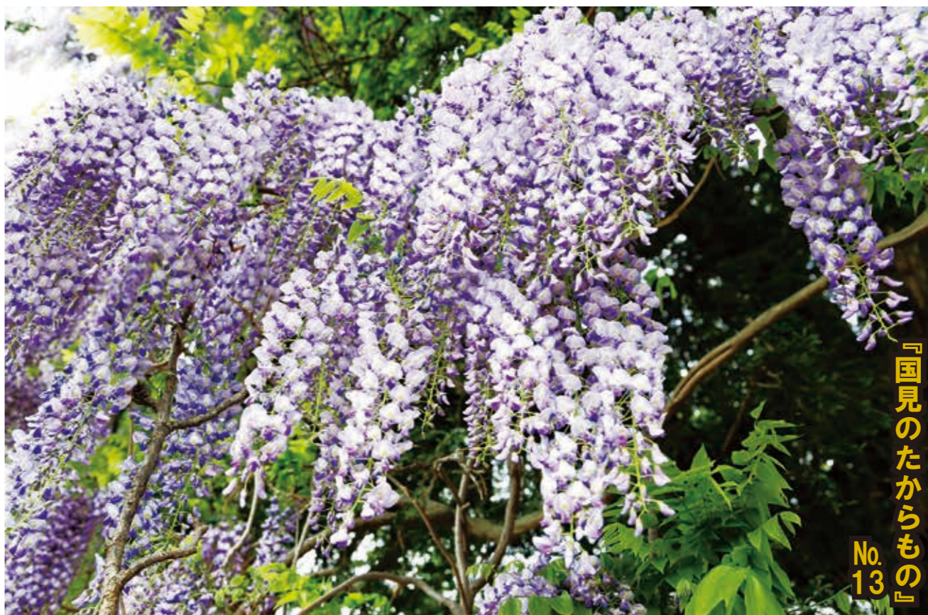
満開に咲き誇った深山神社の大藤（所在地：国見町大字鳥取字深山地内）

深山神社境内の大榎とともに町の天然記念物に指定されている大藤は、4本の木からなり、樹齢は300年以上とも言われています。樹齢500年（推定）の大榎全体に巻き付いた大藤が咲かせる気品に満ちた花と香りは、毎年多くの人々を魅了します。