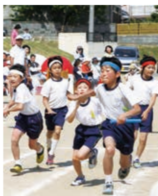
5月17日に国見小学校大運動会が行われました。快晴の青空の下、白熱した戦いが繰り広げられました。