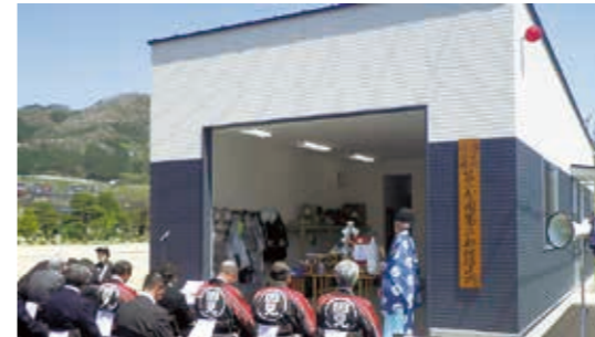
完成した小坂消防屯所

国見町の歴史や文化を紹介する国見町文化財ボランティア（登録者21名）は、4月からの2か月間で町内外10団体のべ200名の人々に国見町を案内しました。「阿津賀志山防塁」や「旧奥州道中国見峠長坂跡」等の場所で、奥州藤原氏や伊達氏・松尾芭蕉など各時代の豊かな歴史や国見の文化を伝えました。