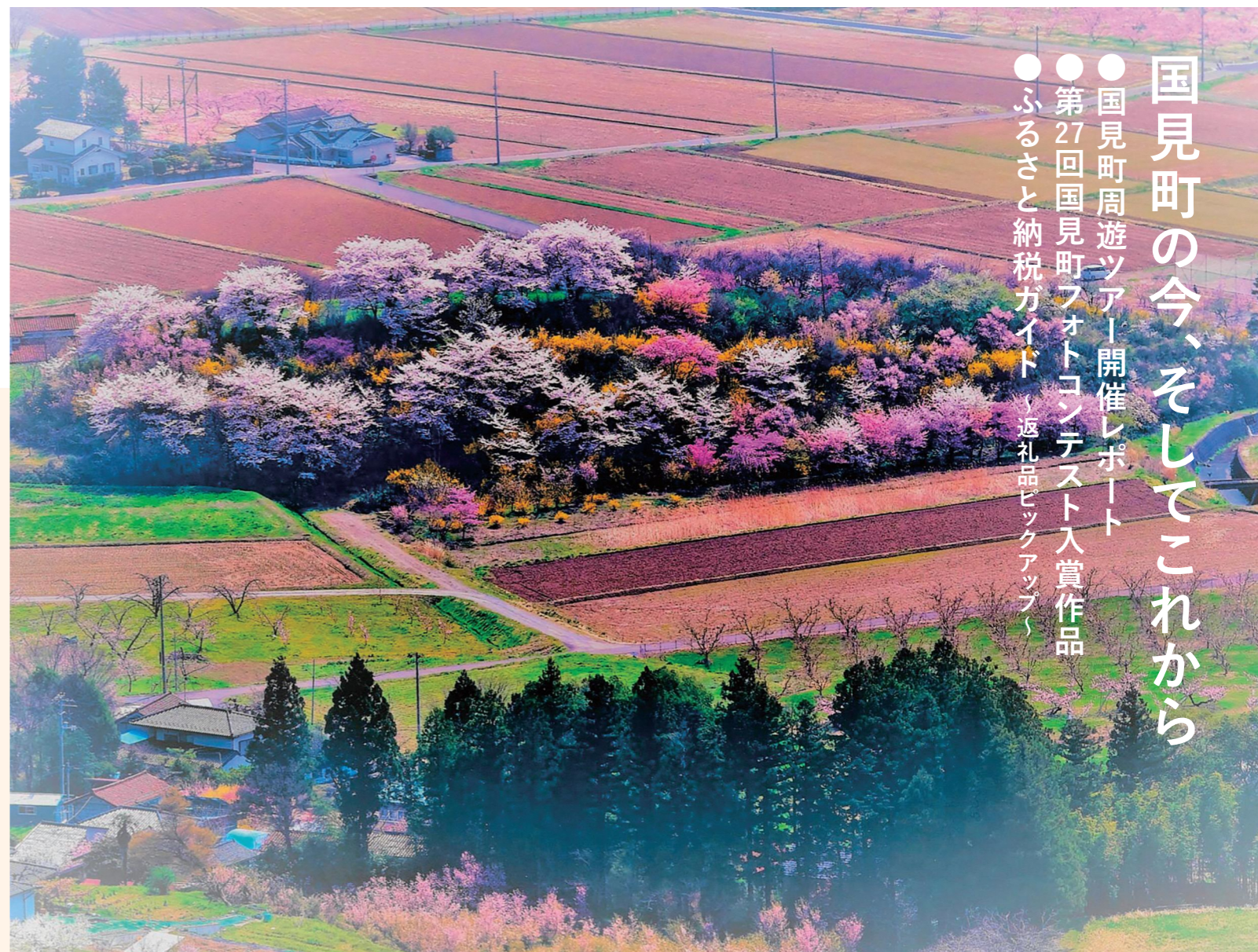
第27回 国見町フォトコンテスト 町長賞「国見の花見山」田中穂積