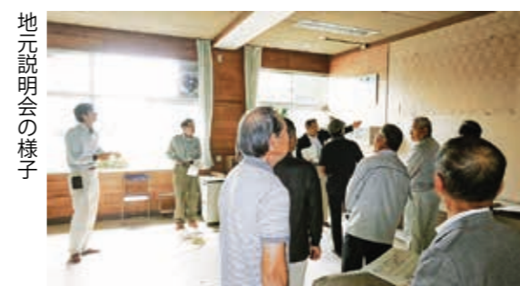
地元説明会の様子

町内の小学校の統合に伴い、平成 24 年 3 月 31 日をもって各学校が閉鎖され、旧小坂小と大木戸小の校舎の利用については「旧小学校施設活用検討委員会」を経て「旧小学校校舎活用計画策定委員会」において検討され、平成 25 年 12 月には「廃校活用基本計画(構想)」が策定されました。 基本計画では、阿津賀志山防塁や岩淵遺跡など多くの史跡がある大木戸地区の特性を生かし、旧大木戸小に「歴史や生活文化の展示・保存機能を持たせる」との方針が示され、具体的な改修計画を進めました。昨年 12 月には説明会を開催し、改修に必要な設計図書作成に取り組み、9 月 27 日に地元説明会を行ったところです。 校舎 1 階部分の約 6 割を活用するため改修し、文化財等の展示スペースや研修室、収蔵室、作業室が配置する計画です。また、地元材を活用し、木のぬくもりを生かし、多目的に利用できるガイダンスコーナー