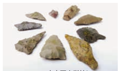
大木戸小学校に保管されていた矢じり