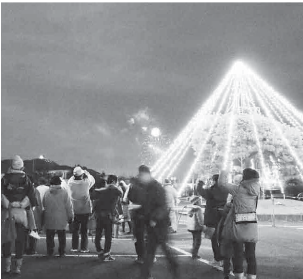
阿津賀志山ピクニック一点灯式