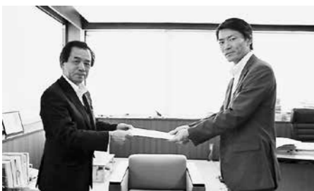
永尾河川国道事務所長へ要望書を渡す町長