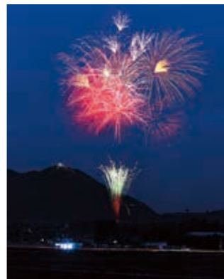
毎年恒例となったあつかし山ビッグツリー。今年は天候にも恵まれ、点灯式では空に大輪の花火が咲きました。