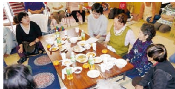
お母さんたちへのインタビュー調査

このような活動を通して発見した「内谷の地域課題」とそれを解決するためのアイデアを学生が提案します。報告は年度末に開催予定の「地域づくりカフェ」で発表されることになっています。