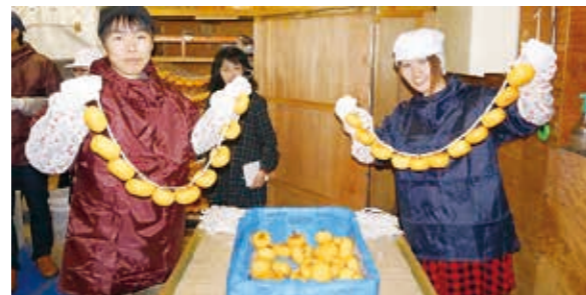
あんぼ柿作りを体験