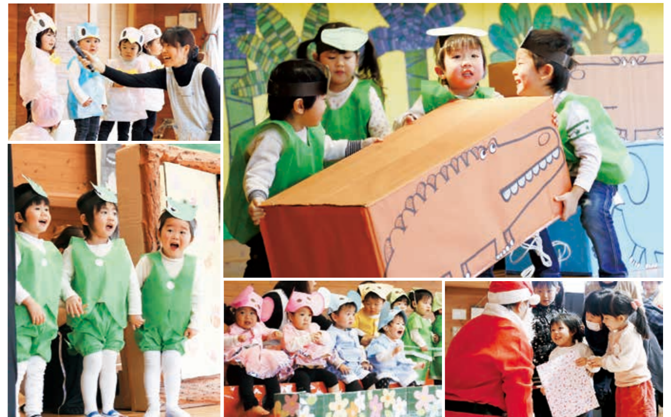
▲ 12 月 12 日 藤田保育所クリスマス会