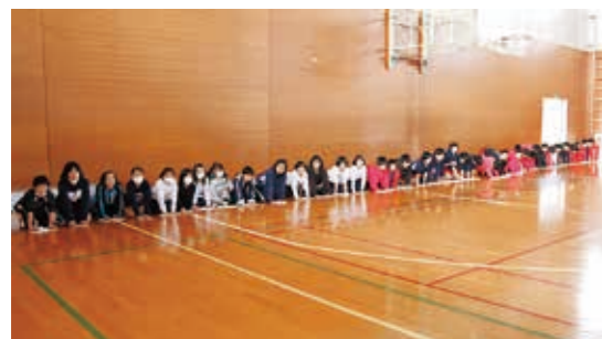
一斉に雑巾がけスタート！

この日は、赤十字奉仕団員約30人が、約180個のおせち料理を作り、各地区の民生児童委員が、一人暮らしのみなさんの元気な姿を確認しながら各世帯へ届けました。