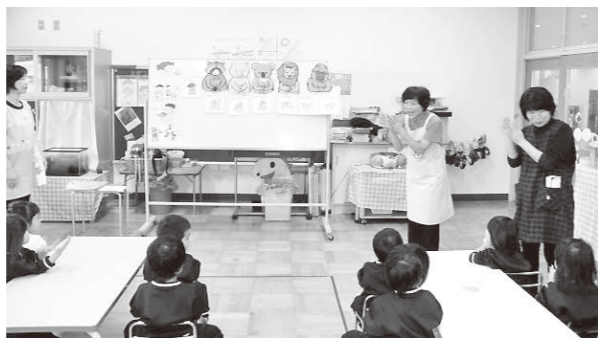
幼稚園食育指導の様子