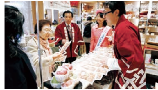
おいしいあんぽ柿いかがですか？

1年間練習でお世話になった体育館のトイレや更衣室、窓ガラスなどを団員や保護者のみなさんが、隅々まで心をこめて清掃しました。きれいになった体育館で新年から気持ち新たに練習が行われます。