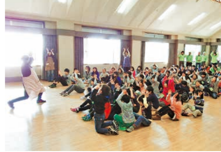
落とさないように、つかむ!

クリスマス行事として毎年開催しているこどもまつりを12月12日、観月台文化センターで、幼稚園年長児から小学校6年生まで75人と地域のサークルのみなさんなど34人が参加し、行いました。 「人形劇サークルエプロン」のレクリエーションから始まり、人形劇の鑑賞、「よみきかせみみずく」による絵本の読み聞かせ、「国見話の会」によるビーズブローチ作り、国見っ子わんぱく広場指導員によるクッキーづくり、紙トンボ