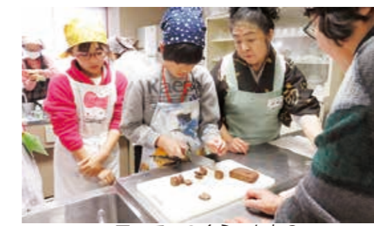
一口ってこのくらいかな?

づくりや紙ホイッスルづくりを体験。そのほか、積み木遊びや陣取り遊び、マンカラゲームなど子どもたちは自由に好きな場所で好きな遊びを楽しんでいました。 5・6年生は、杉崎一江先生とくにみ女性教室ボランティアのみなさんの指導によるスノーボール(雪玉クッキー)作りを体験。一口大のクッキーに子どもたちは「サクサクしておいしい!」と満足顔でした。 参加者には、女性教室ボランティアのみなさんによ