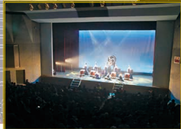
リニューアルした ホールを彩った 3ステージ