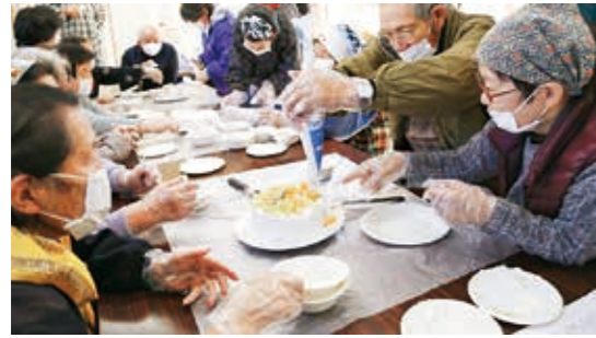
笑顔いっぱいのケーキ作り