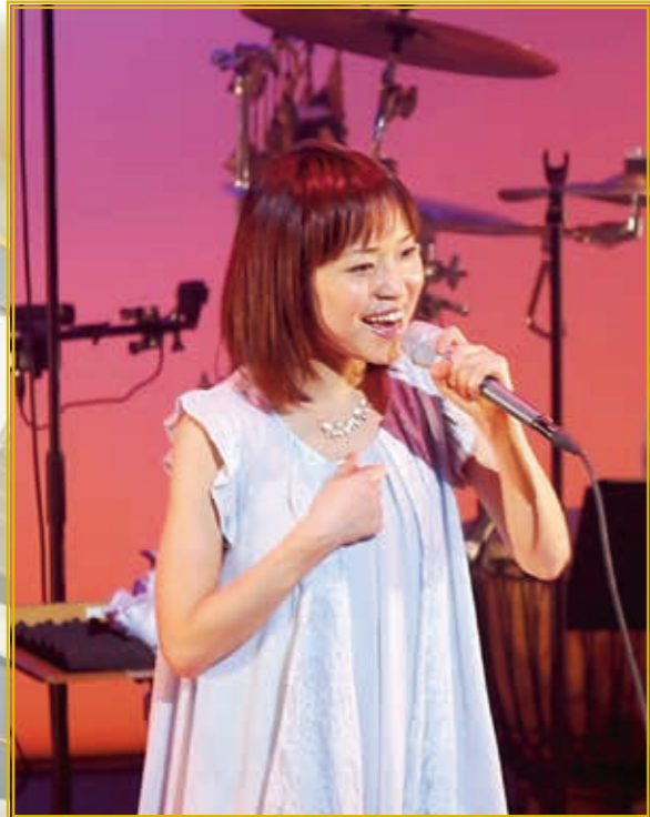
川嶋あいコンサート