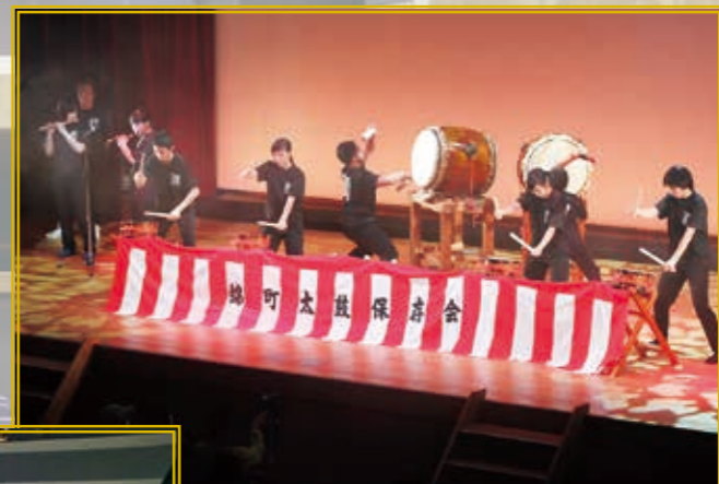
和太鼓フェスティバル