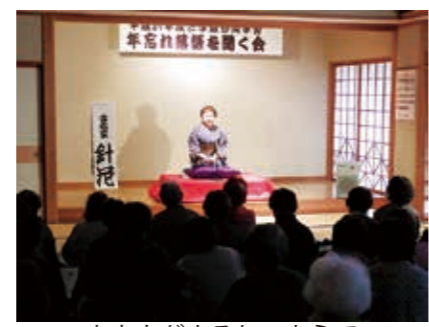
おあとがよろしいようで

「落語を聞く会」が12月11日、観月台文化センター第一和室で開催され、約70人が参加しました。 出演者は「ふくしま素人落語の会」の7人で、今年は女性の方の出演もありました。 学級生のみなさんからは「落ち」が語られる度に大