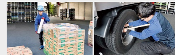
▲ 運送中に荷崩れしないよう固定する ▲ 運送前に必ず行う車両点検