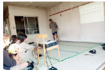
▲ 8月に商店街空き店舗で上演した演劇公演（『ストミック寄席 夏』の様子）

上半期は、道の駅新商品「桃味噌」のパッケージを高校生と制作したほか、CM 大賞の映像制作への参加やワークショップ「ハンコで国見手拭い作り」「自分で作る缶バッジ」の開催、自作した「くにみもたんハンコ」が芸術祭のスタンプラリーに採用されるなどしました。これまでの活動報告やワークショップの受付状況など、詳細は下記の Instagram にてご紹介していきます！