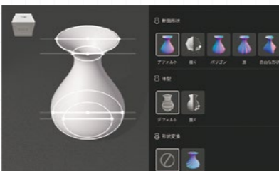
▲ 1月開催！3Dプリンターで花瓶を印刷しよう