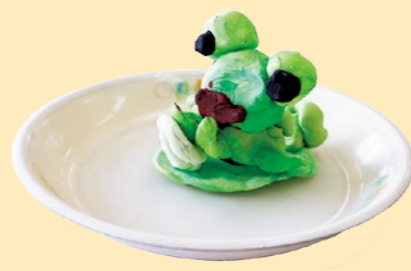
「かえるのうちゅうせん」