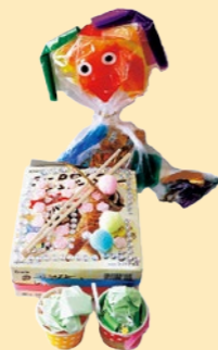
「おひめさまのランチタイム」