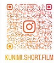
▲ 国見町公式 Instagram「ふたつの空と、いくつもの私と。」も継続して更新中！