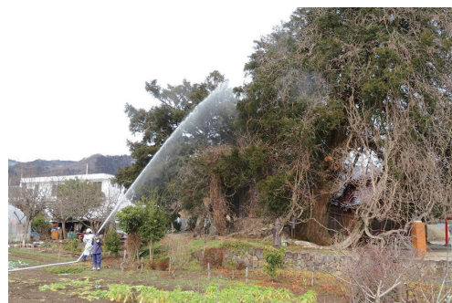
深山神社での訓練の様子