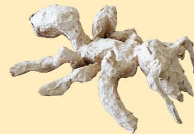
【何かを探しているアリ】 鈴木 翔太