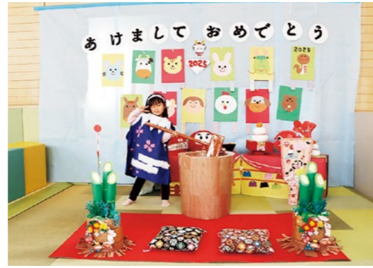
餅つきしながらハイポーズ！

くにみもたん広場では、布地で制作した門松や餅つきなど、お正月にまつわるものを展示しました。年末年始に帰省した親子や孫と遊びに来た方が多く来場し、正月飾りの前で写真撮影をするなど、家族との時間を楽しんでいます。くにみもたん広場では、未就学児向けの遊具のほか、四季折々のイベントや展示を行っています。皆さんのご来場をお待ちしています。