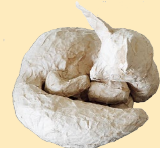
【顔をあげるフェネック】 菊地 莉愛