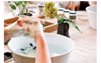
▲CoeurさんによるクレイとハーブのハンドバスWS