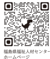
福島県福祉人材センター ホームページ

テクノアカデミー郡山では、ハローワークに求職の申込みをし、受講あつせんを受けられる方を対象として、国家資格「介護福祉士」の取得と介護福祉業界での正社員就職を目指すことを目的とした2年間の教育訓練を委託により実施します。 ▼募集コース 介護福祉士養成科 ▼訓練期間 令和7年4月