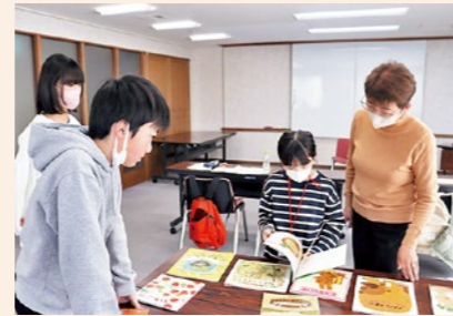
絵本の選書を学ぶ参加者

その後、おはなし会の進め方や手遊びの指導をいただき、本を選書し役割分担を決めました。講師のアドバイスを受けながら練習を重ね、閉講式のおはなし会に向けて頑張る姿が見られました。