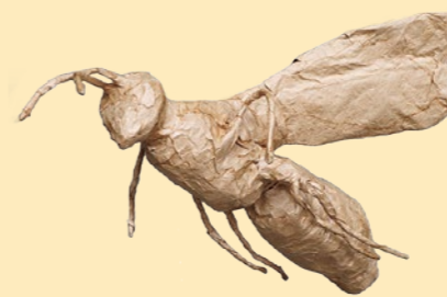
【素早く移動するスズメバチ】 井砂 海志