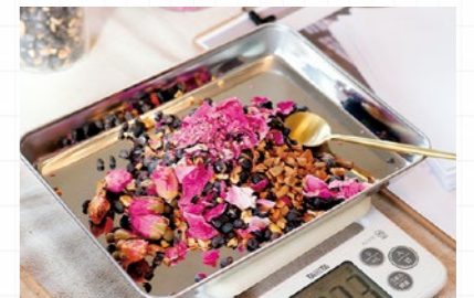
▲港屋漢方堂さんによる漢方茶WS