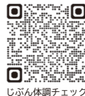
じぶん体調チェック

「健康ふくしまポータルサイト」では、20の質問に回答するだけで自身の健康リスクを確認できる「じぶん体調チェック」を展開しています。自分の体の状態を手軽に把握できます。さっそく試してみましょう！