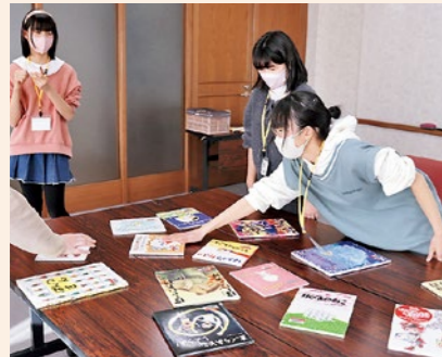
おはなし会に向けて絵本かるたの練習

第12回子ども司書活動では、閉講式でのおはなし会に向けての打ち合わせを行いました。今までの活動を振り返りながら子ども司書が意見を出し合い、おはなし会のプログラムを組み立てました。皆で話し合いながら本を選書し練習を重ね、意欲的に活動する姿が見られました。