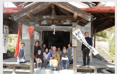
■ 観音講(観音様を守る会)

鳥取集落では、福源寺地蔵庵観音堂を観音講の人々が守り、巡礼者へのもてなしや法会が行われています。観音信仰が地域に根付き、鳥取集落の人々により活動が続けられてきています。