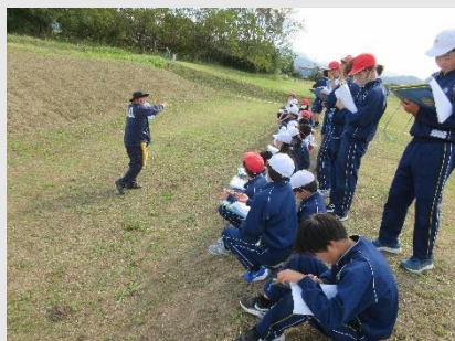
■ 顕彰活動(案内活動)

阿津賀志山とともに本町のシンボルである「阿津賀志山防塁」は、合戦が行われてから800年間、人々により守られてきました。現在も顕彰活動が行われ、町民が共有する誇りと町の歴史性を感じる場所となっています。