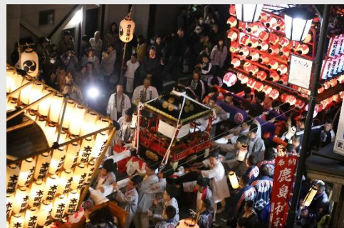
■ 鹿島神社例大祭(もみ合い)

旧藤田宿では、山車と神輿が激しくぶつかる、もみ合いを特徴とする「鹿島神社例大祭」が現在も行われています。かつて旧奥州街道の宿場町としてにぎわいをみせた町並みの歴史と伝統を反映した活動が多くの人々により受け継がれています。