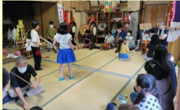
●子ども太々神楽教室

祭礼や神楽等の伝統芸能の活動内容の把握と映像による記録作成など、学術調査とともに、用具の修繕や活動の支援を行う。