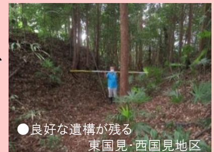
●良好な遺構が残る 東国見・西国見地区

史跡の総合的な保存・活用を進めるために必要な保存活用計画の策定を行い、未指定範囲を含めた保存目的の発掘調査とその成果に基づく史跡の追加指定、公有地化、史跡整備を行う。