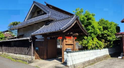
■ 国登録有形文化財「松田家住宅」