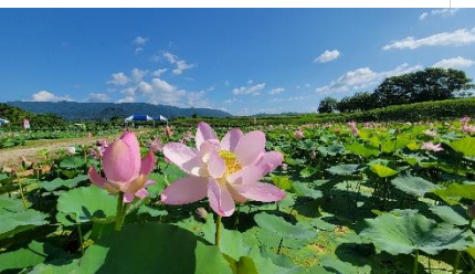
■ 国史跡「阿津賀志山防塁」(下二重堀地区) あつかし千年公園