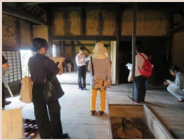
●くにみ案内人 研修講座の様子

町の歴史や人々の伝統的な活動や町並みと現在の国見町について語ることができる人材の育成を図る。案内ガイド（くにみ案内人・あつかし歴史館サポーター）の養成・研修を目的とした、講習・現地視察等を実施する。