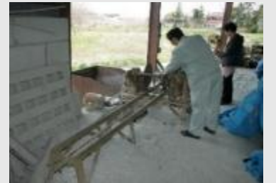
■ 現在も使われている石材加工場

国見石が産出する本町の特徴的な産業である石材業は、大正・昭和の歴史的な石蔵とともに守られています。石工技術により町内一円に建築された石蔵が、本町を特徴づける固有の景観となり残されています。