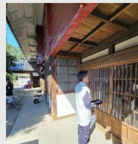
■ 水雲神社例大祭での宿(やど)の活動