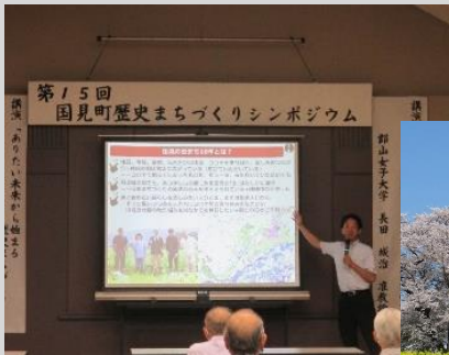
●歴史まちづくりシンポジウム

歴史を活かしたまちづくりや町並み・景観の維持・向上に関して住民向けの講演会、ワークショップ、シンポジウム、文化財活用イベントあつかし歴史館イベント、歴史ウォークの開催を行う。