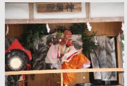
■ 内谷春日神社太々神楽

内谷春日神社では、祭礼で奉納される太々神楽が明治15年(1882)より地区の人々の協力により継承されています。社殿に響く太鼓と笛の音色が、地区の伝統芸能と祭礼のにぎわいを伝えています。