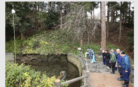
■ 御瀧神社の湧水に対する信仰

光明寺集落では、清らかで豊かな湧水が伝統的な水利用と信仰に結びついています。湧水と信仰に伴う活動により清浄な空間が作り出され、現在も歴史的な寺社が残る聖域を形成しています。