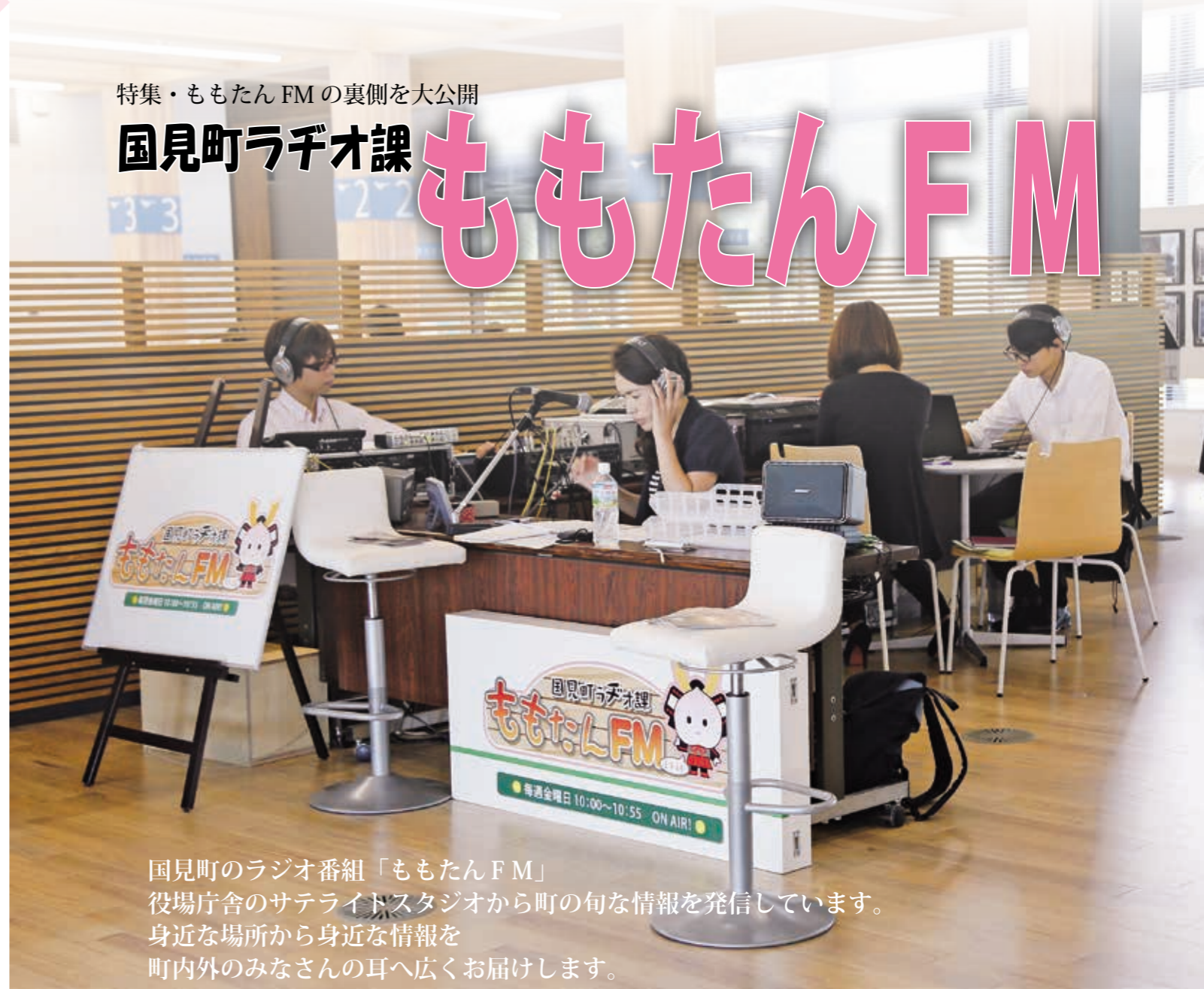
国見町のラジオ番組「ももたん FM」 役場庁舎のサテライトスタジオから町の旬な情報を発信しています。 身近な場所から身近な情報を 町内外のみなさんの耳へ広くお届けします。

国見町「初」の試み 金曜日の午前10時といえ ば？ みなさんすっかりお なじみですよ。 「国見町 ラジオ課ももたん FM」で す。国見町の情報を県内全 域に放送している、ふくし ま FM のラジオ番組です。 町内やイベントなどで取材 しているももたん FM ス タッフを見かけた方やイン タビューを受けたことがあ るといふ方もいると思いま す。 ももたん FM は震災後、 国見町の元気を取り戻すた め、町の魅力をラジオを通 して町内外へ広く発信しよ うと始まりました。国見町 だけの話題を取り上げ、生 放送で毎週55分間の番組と すること、役場内のサテラ イトスタジオで放送するこ となど、他に例を見ないス タイルで放送が始まりまし た。 第1回目が放送された平 成24年5月25日から4年が 経過し、放送回数はこれま で220回を超えています