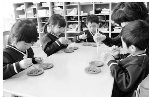
年中組『豆つかみゲーム』