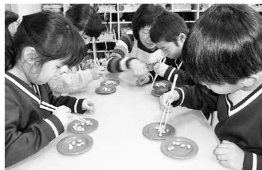
年長組『豆つかみゲーム』