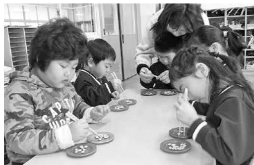
年長組『豆つかみゲーム』