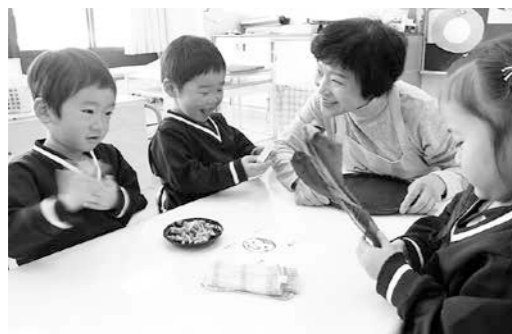
年少組『給食について知ろう』

町では食生活改善推進員のみなさんと栄養士が出向いて、くにみ幼稚園の子どもたちを対象に食育教室を開催しています。1月は7回実施しました。