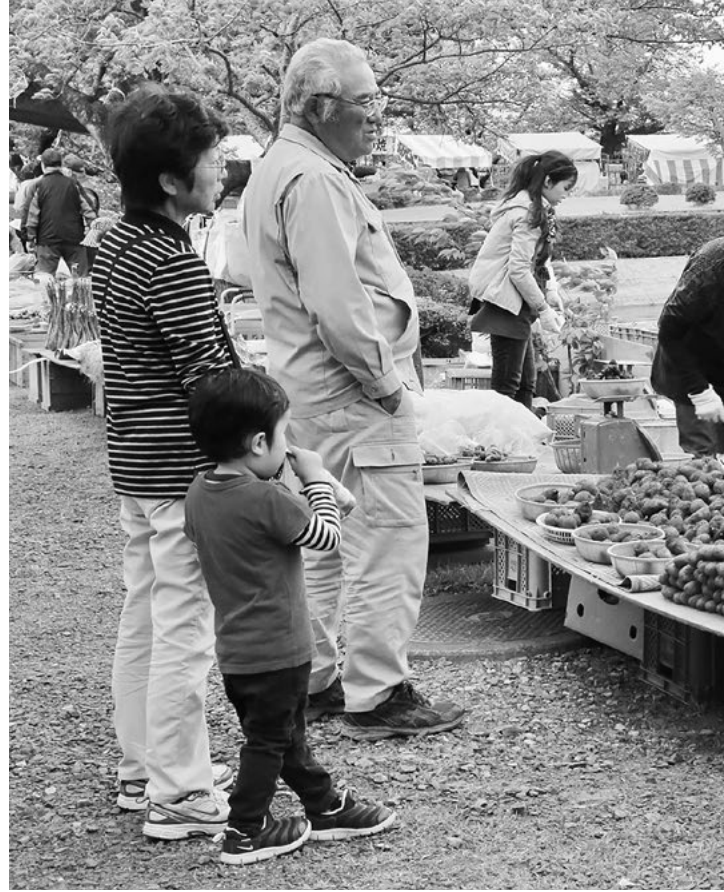
加工施設の完成が待ち遠しい(農業市のようす)