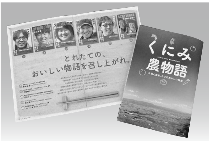
トップセールスや連携自治体との交流などで国見町のPRに使用される