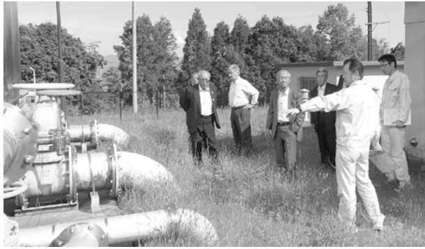
町内への給水元を視察

①町の水道施設②水道料金③今年度予定している水道事業の主な事業の3点について説明を受け、国見受水施設（泉田大字三ツ谷）の現地を視察してきました。