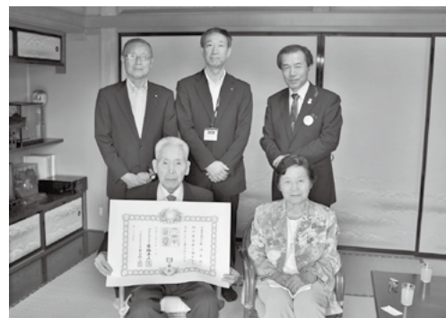
ご自宅で阿部振興局長から伝達