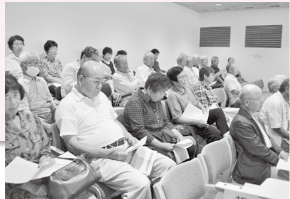
初めての方にもたくさん来ていただきました