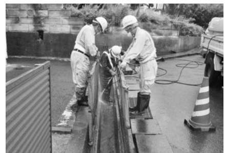
今も除染作業は 続けられている