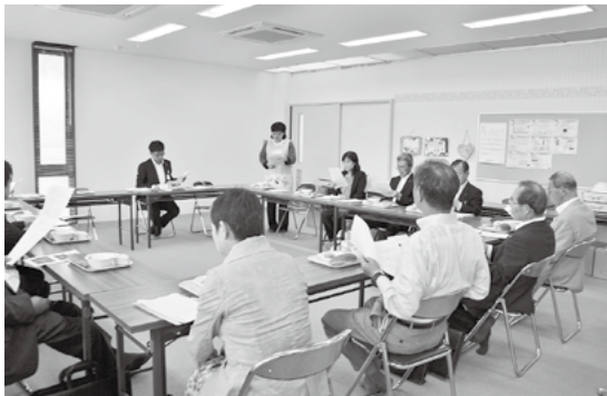
給食試食の前に献立のポイントを確認