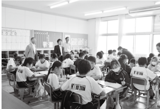
子どもたちは授業に真剣に取り組んでいます