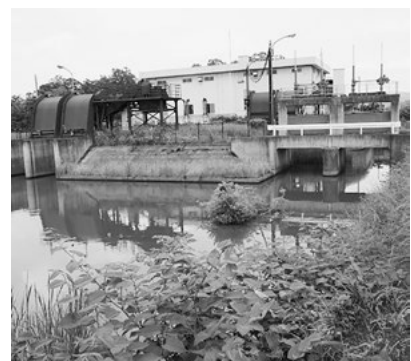
普段は穏やかな湛水防除施設

産業振興課長 開発はそれぞれ法律により安全性が担保される。また、湛水防除施設の増設には整備基準があり、気象状況の大きな変化や流域面積の拡大などがない限り、増設は困難である。