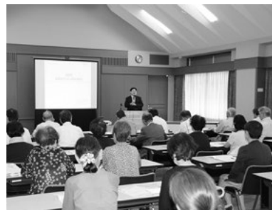
結婚世話やき人説明会には約50人が参加した