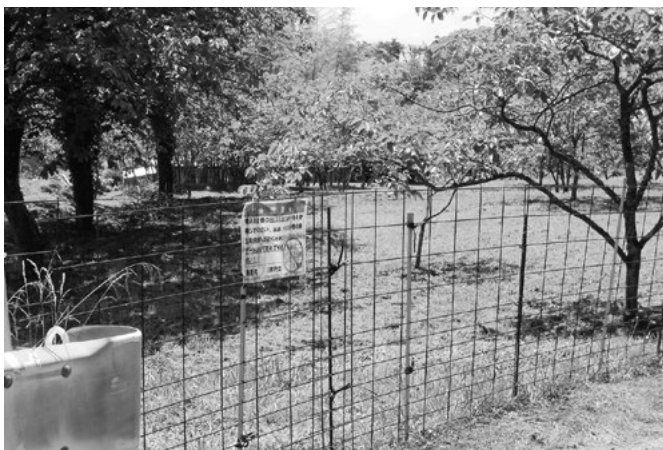
地元住民が協力して侵入防止柵を設置