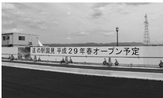
道の駅オープン案内は国道4号からもよく見える

たが、今後は適時適切に行っていく。概要については3回町民説明会も行っており、変更はあったが施設の規模や機能など基本的なところは何も変わっていない。今後は、ソフト面で6次化も含めどう進めていくか、議会や町民とも十分に連携を図りながらの対応が大切な課題だと強く認識している。