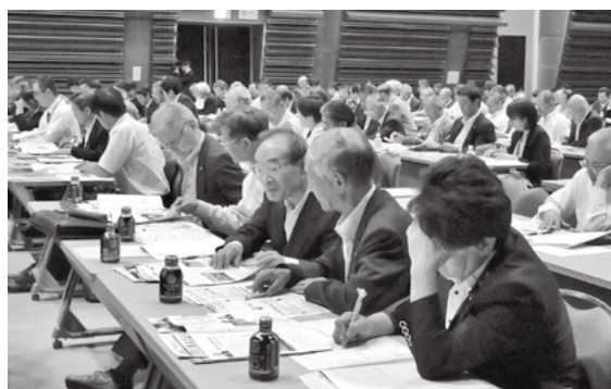
他町村議会広報紙をもとに改善点を学ぶ

5月20日、郡山市ビッグパレットふくしまで町村議会広報研修会が開催され、広報委員5人で参加しました。