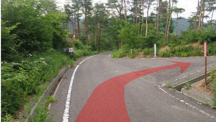
【ポイント5】 看板を目印に、右折します。