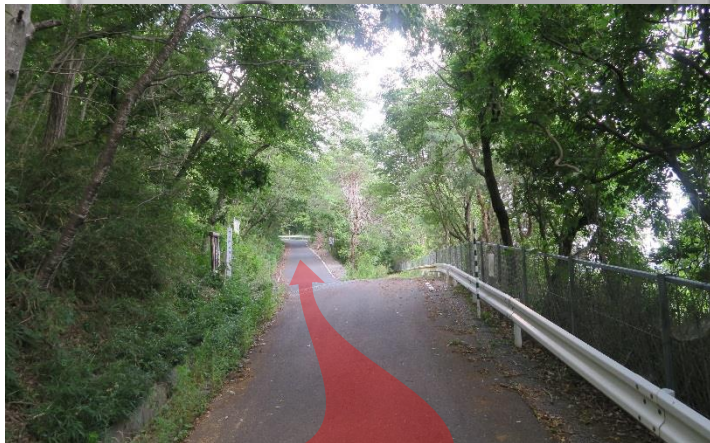
【ポイント4】 高速道路脇の道路を進むと、道路が2つに分かれています。左手(山手)の道を進んでください。