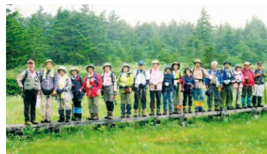
ハイキングに参加したみなさん