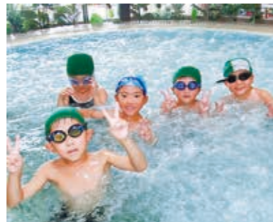
泡のプールを楽しむ子どもたち

国見っ子わんぱく広場は7月21日、野外活動を行いました。 午前中はらちやんランドセル工場見学とキーホルダー作りを体験。自分で選んだランドセルの皮で世界一つのオリジナルのキーホルダーを完成させると、とても満足そうでした。 午後はホテルリステル猪苗代で屋内プール遊びに熱