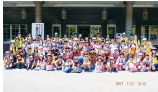
たくさんの楽しい思い出ができました

国見っ子わんぱく広場は7月21日、野外活動を行いました。 午前中はらちやんランドセル工場見学とキーホルダー作りを体験。自分で選んだランドセルの皮で世界一つのオリジナルのキーホルダーを完成させると、とても満足そうでした。 午後はホテルリステル猪苗代で屋内プール遊びに熱