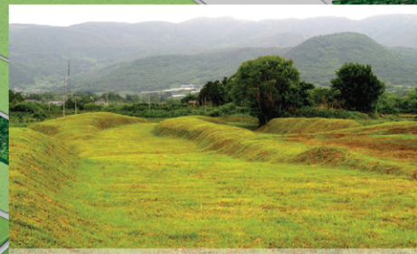
下二重堀地区 阿津賀志山防塁の末端近くで最も残りが良く二重堀の構造が明確