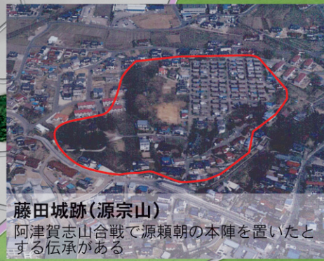
藤田城跡(源宗山) 阿津賀志山合戦で源頼朝の本陣を置いたとする伝承がある