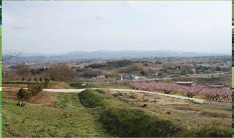
国道4号北側地区 阿津賀志山防塁でも眺めがよく藤田城や信達盆地を一望できる