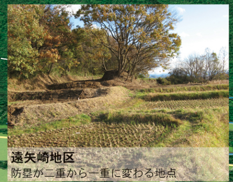
遠矢崎地区 防塁が二重から一重に変わる地点