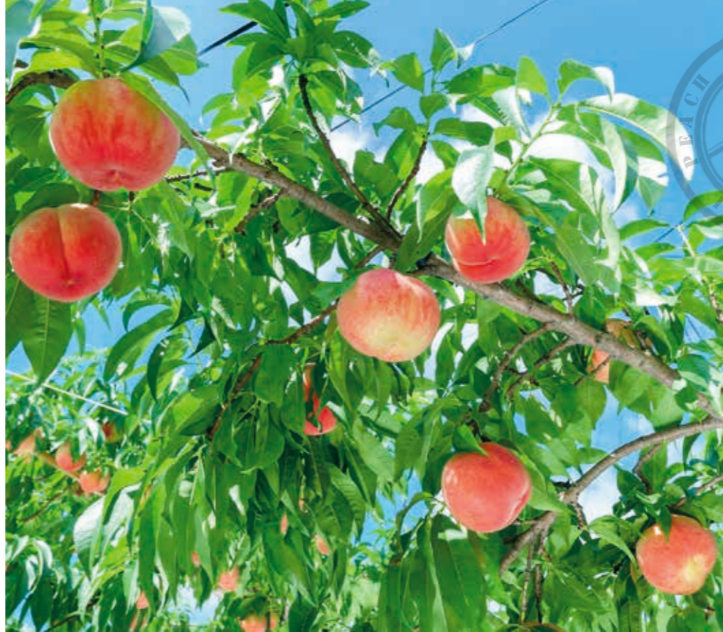
太陽の恵みをたっぷりと浴びた国見自慢のモモ