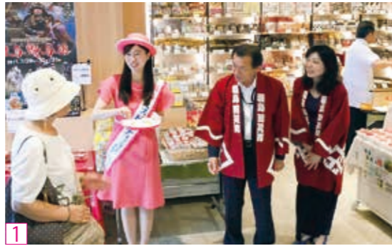
1 NPO 法人品川女性起業家交流会にも支援いただきました