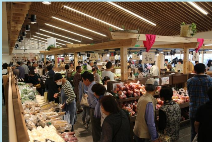
交流連携の拠点 道の駅国見あつかしの郷