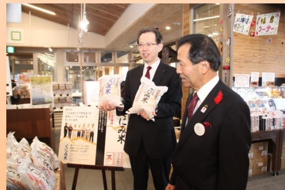
内堀知事が道の駅国見を視察