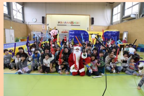
ももたん広場 クリスマス会