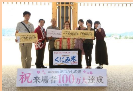
29年10月3日 来場者100万人達成