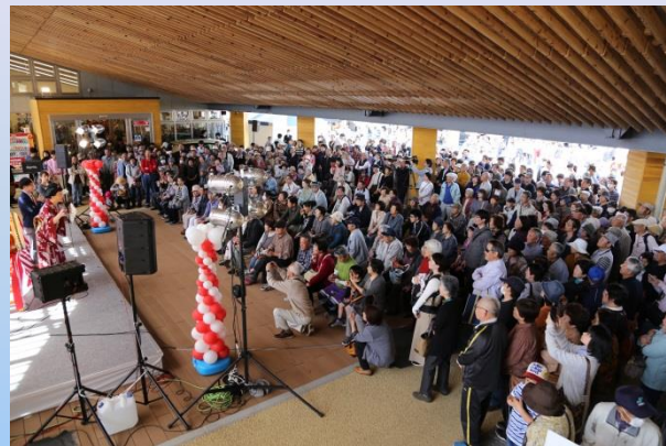
交流連携の拠点 道の駅国見あつかしの郷