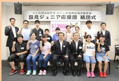
ジュニア応援団（結団式）