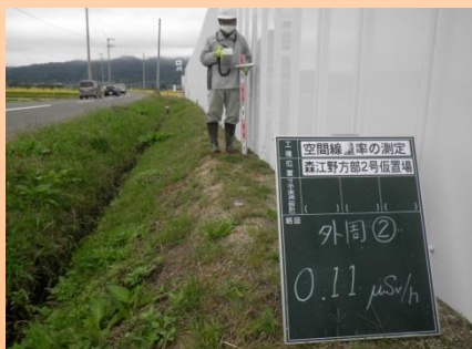
除染対策(仮置場管理)