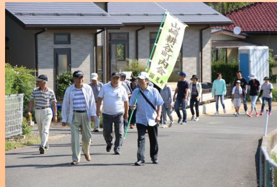
防災訓練(避難訓練)