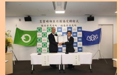
災害協定(栃木県茂木町)