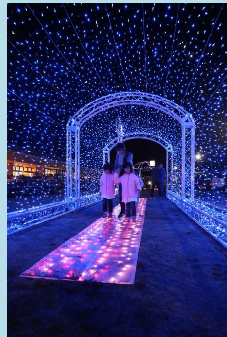
イルミネーション