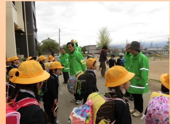
安全ボランティア見守り活動