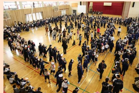
幼小中一貫教育 国見っ子まつり