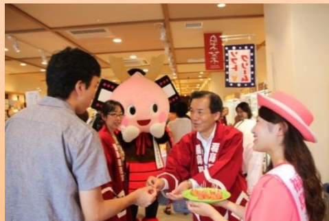
東京日本橋ふくしま館