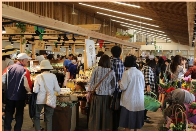
連日多くの来場者により地域が活性化