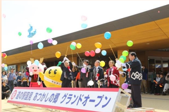
29年5月3日グランドオープン