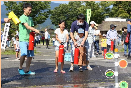
防災訓練(消火器訓練)