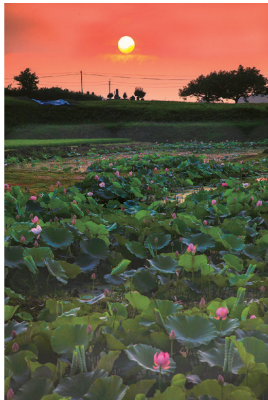
最優秀賞 佐藤尚久『夜明けの中尊寺ハス』