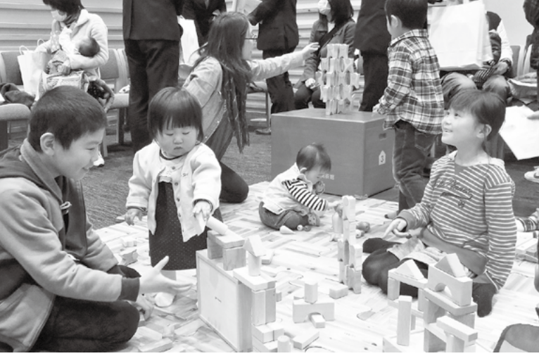
木のおもちゃで遊ぶのも楽しいね(3月ウッドスタート宣言協定書締結式)