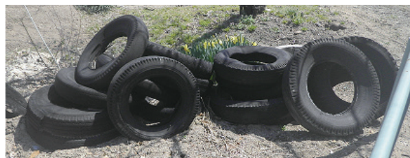
不法投棄はダメ！ゼッタイ！