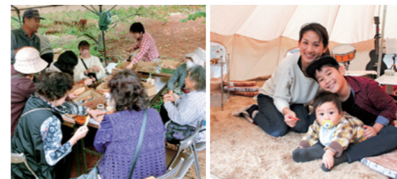
大人気の柿渋コースター