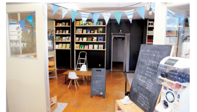
新刊やおすすめの本が並ぶライブラリー