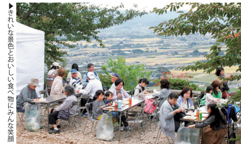
きれいな景色とおいしい食べ物にみんな笑顔

来場した人たちからは、 「景色がいい場所での食事 はおいしかった」「山の 上のテントは楽しめた」と いった声が聞かれました。 企画した学生たちは「昨 年からこのプロジェクトを 考えてきた。打ち合わせを 重ねるごとに内谷の人が明 るくなって、みんないきい きとしてきたのが良かった」と振り返りました。 桐目木花の里に笑顔が広 がった一日でした。