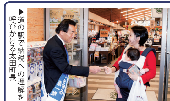
道の駅で納税への理解を呼びかける太田町長