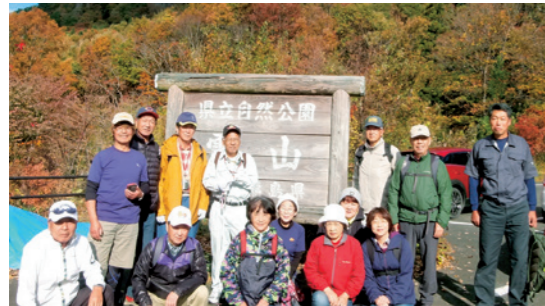
ハイキングを通して交流を深めた参加者

道の駅国見あつかしの郷からバスで巡る「秋のくにみ周遊ツアー」が11月8日と9日に行われ、仙台圏を中心に40人が参加しました。ツアー参加者は、くにみ案内人の説明を聞きながら奥山家住宅洋館や阿津賀志山防塁下二重堀地区などを巡るまち歩きを満喫した後、「あんぼ柿」作りを体験。参加者は農家の説明を聞きながら皮むきや紐通し作業を体験しました。