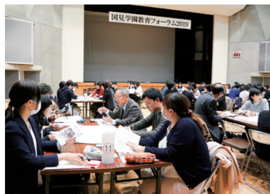
「家読」を楽しく続けるために100人で熟議