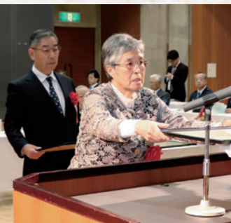
功勞表彰の受賞者

学術、芸術、スポーツなどにおいて町の名声を高め、町民の誇りとなる抜群の成績を収めた方などをたたえるものです。