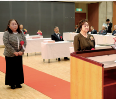
善行表彰の受賞者