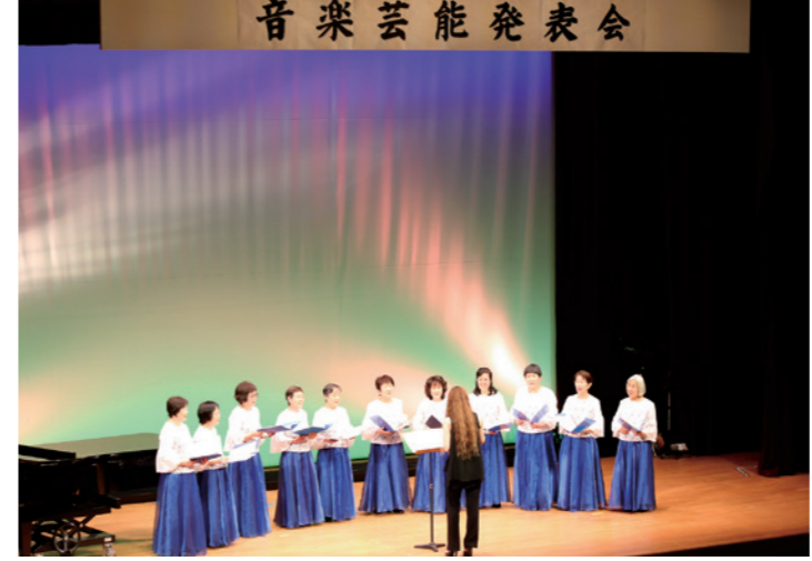
日頃の練習の成果を披露する出演者

【音楽芸能発表会】 音楽芸能発表会が10月27日、観月台文化センターホールで開かれ、町文化団体連絡協議会加盟の26団体298人が出演しました。発表会では、合唱や舞踊、カラオケなど、89演目にもわたる多彩なステージ発表が行われ、出演者は日頃の練習の成果を披露し、多くの来場者を魅了しました。 【総合展示会】 総合展示は11月2日と3