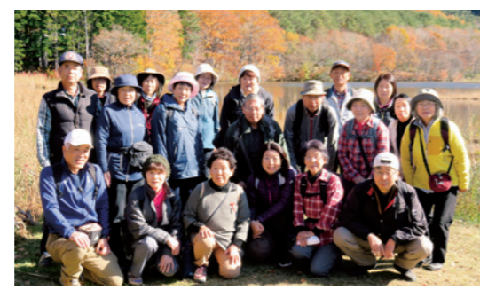
会津の紅葉を楽しんだ参加者

町民ハイキングが11月9日、19人が参加して行われ、下郷町の観音沼森林公園の自然を楽しみました。天候にも恵まれ、参加者は、紅葉の色づく風景を堪能しながら散策や食事を楽しみました。また、参加者は、塔のへつりや大内宿といった会津の観光地を散策し、会津の紅葉などを満喫する一日となりました。