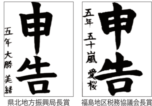
県北地方振興局長賞 福島地区税務協議会長賞