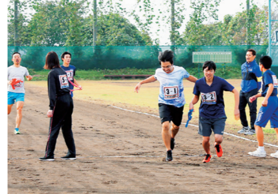
懸命にタスキをつなぐ選手たち