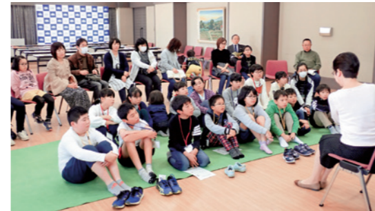
いい本に出会うためには

また、訓練所で収穫した野菜の直売や焼き芋の提供などもあり、参加者は訓練所の取り組みについて理解を深めています。