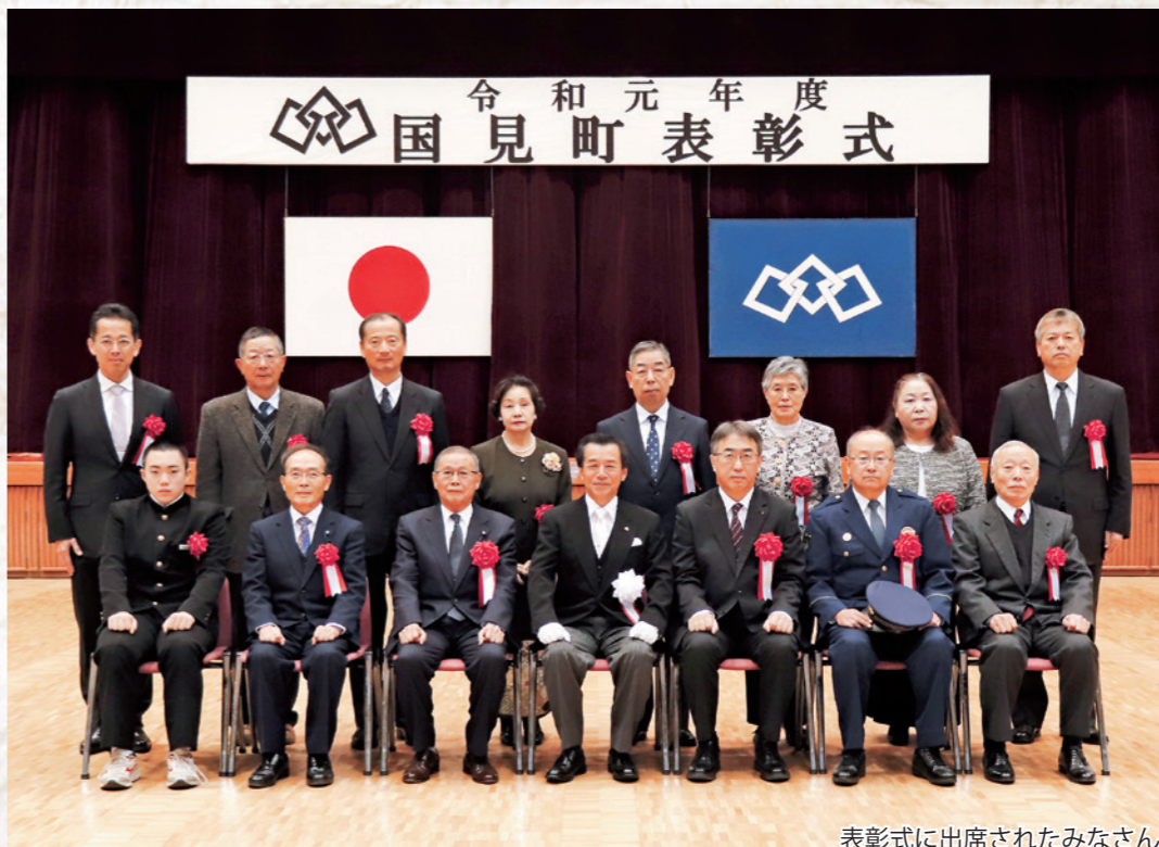
表彰式に出席されたみなさん