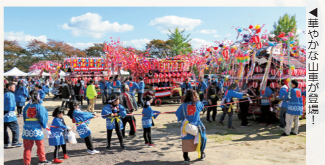
◀ 華やかな山車が登場!

また、この日に行われていた地域の鎮守である高城国見神社の例大祭で繰り出した神輿と山車3台があつかしまつりの会場を巡行しました。巡行は4年に一度行われるもので、大勢の人たちが華やかな山車と共に会場を訪れました。昼には、芋煮と餅つきが行われ、多くの子どもたちが臼と杵での餅つきを体験し、つくたての餅をほおばりました。