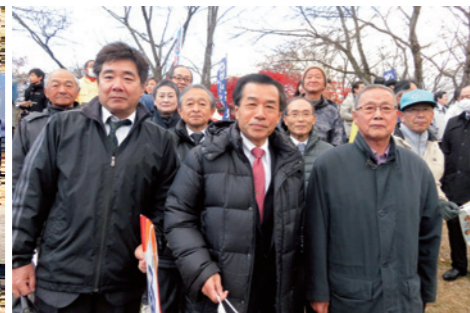
国見町応援団が熱い声援を送りました