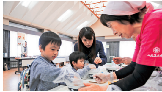
親子で豆腐を使った白玉だんご作りに挑戦