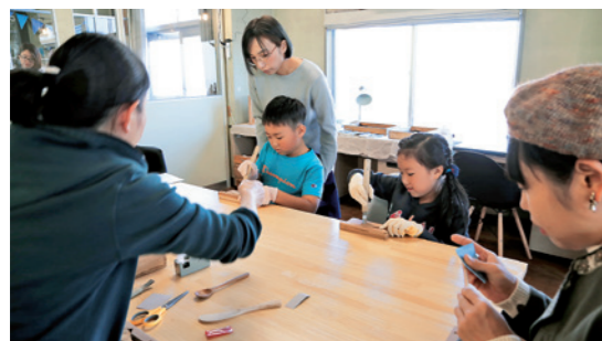
木のスプーン作りに挑戦

当日は天候にも恵まれて、少し汗ばむくらいの陽気となり落ち葉を踏みしめながら秋の霊山をハイキング。参加者は楽しみながら地域の交流を深めました。