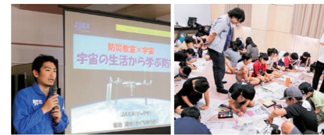
8月のキッズ防災教室で宇宙教室と備蓄食のデザインを考える

国 見町は10月25日、株式会社陽と人とともに株式会社ワンテーブルと宇宙航空研究開発機構（JAXA）が協働で取り組む「BOSAI SPACE FOOD PROJECT」にパートナーとして参加するための確認書を締結しました。