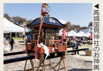
◀ 高城国見神社のお神輿