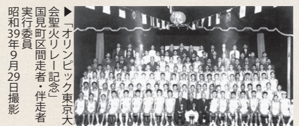
▶「オリンピック記念」 会聖火リレー記念 国見町区間走者・伴走者 実行委員 昭和39年9月29日撮影