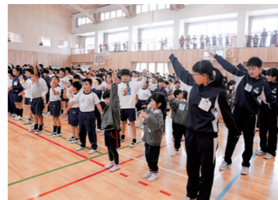
みんなで練習したダンスを披露するくにみっ子たち

今年は「みんなでいっしょに全力で夢へはばたけ国見の未来」をテーマに、ダンスや楽器演奏、合唱などを披露して、子どもたちが交流を深めました。