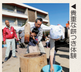
◀ 貴重な餅つき体験

地域の人たちが一つになり、地元の伝統を受け継いでいくことの大切さを感じた一日でした。