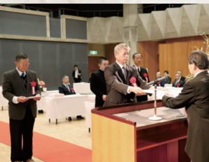
荣誉顕彰の受賞者