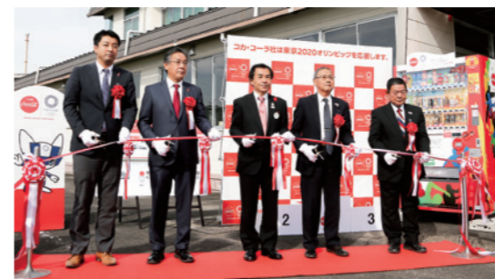
支援機導入を記念してテープカット

首都圏などから参加した12名は、フィールドワークや農作業体験を通して、さまざまな知恵や技術を持つ人と出会い、話を聞き、国見の地域性を理解することで、さまざまな生き方や考え方があることを学びました。