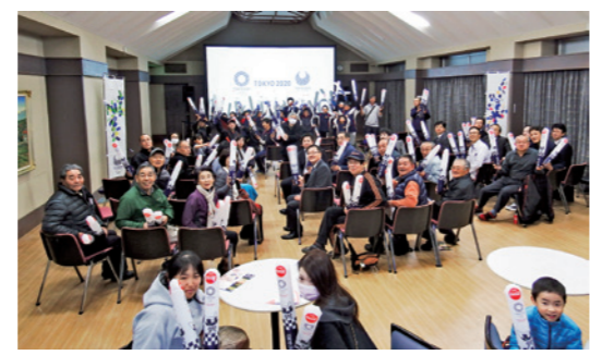
迫力ある画面に大満足！

WBSCプレミア12オープニングラウンドの日本対プエルトリコ戦のパブリックビューイングが11月6日、観月台文化センターで行われました。会場には220インチの特大スクリーンが設置され、来場者は野球日本代表・侍ジャパンの迫力ある活躍を試合会場にいるような気分で見ることができました。本事業は、WBSC(世