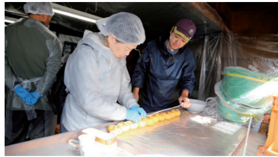
あんぼ柿作りを体験する参加者

「くにみ食の映画祭」が11月4日、観月台文化センターで行われ、給食で昔ながらの和食を提供している保育園のドキュメンタリー映画「いただきます みそしるをつくるこどもたち」を親子で鑑賞しました。食育体験コーナーでは、親子でみそ玉作りや豆腐を使った白玉だんご作りなどを体験したほか、国見かあちゃんグループによる豆腐ごはん豚汁に舌鼓を打ちました。