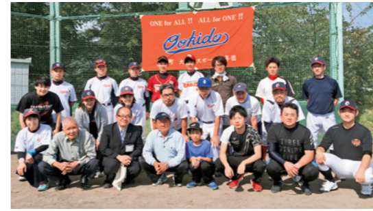
ソフトボールで交流を深めた大木戸地区のみなさん

懇談会では、町や商店街を取り巻く現状について情報共有するとともに、商店街活性化やまちづくりに関する提案など、積極的な意見交換が行われました。